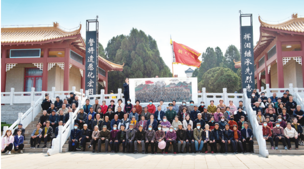
丰仪店村的“全家福”。

这份沉甸甸的渴望,赢来了真情的回应。2020年末,远在成都的年轻女画家李桃,无条件地接过了重托。她愿意无偿为53名英雄作画。她在网上对慕泉欣说:“您的赤诚令我感动,我要做一个有情怀的人!”