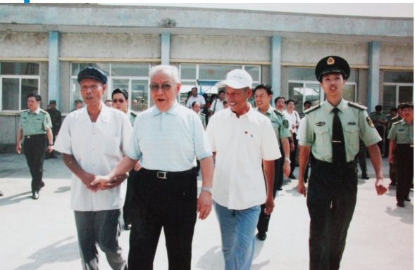
迟浩田将军(左二)接见吕永顺。

据吕永顺回忆,他年纪小,眼疾手快,一会儿就将5个靶击倒,而爷爷毕竟60岁了,眼花动作慢,还有一个靶没有命中。他便偏过身去,“砰”的一枪,帮爷爷将靶击倒。坐在观礼台上的周恩来总理看到这一幕,兴奋地站了起来,为他们鼓掌。祖孙三代不知道的是,他们一上场,就引起了毛主席的注意,他从椅子上站起来,饶有兴趣地看着这三个扛着各式枪、年龄相差较大的民兵。他们表演结束后,毛主席高兴地直鼓掌,连说:“了不起,了不起!”又问:“给他们照相了没有?”罗瑞卿说:“照了。”后来,祖孙三人在看纪录片《向毛主席汇报》时看到了这一幕,激动不已。