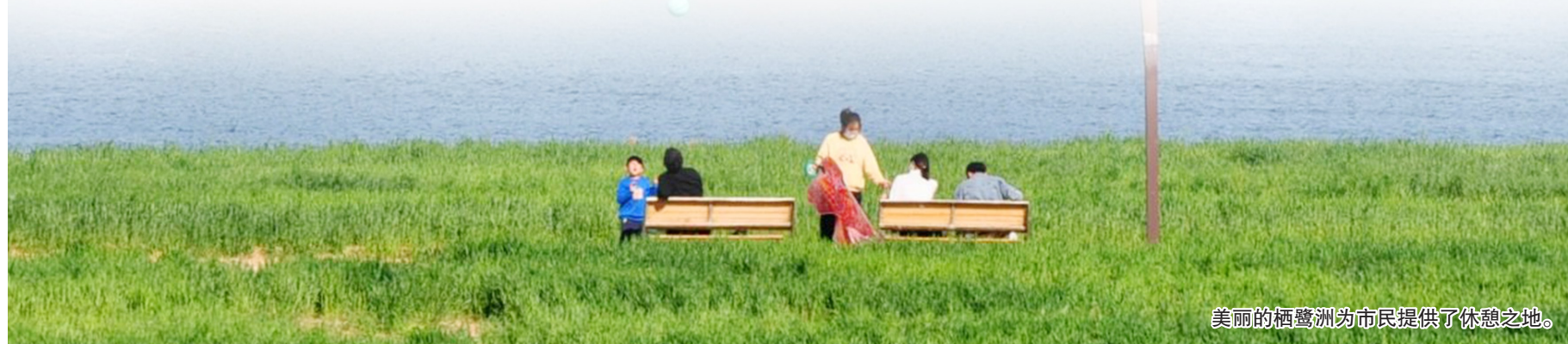
美丽的栖鹭洲为市民提供了休憩之地。

向“绿水青山”发展,建设“高品质开放空间”,打造市民喜爱的节点景观……一幅“河畅、水清、岸绿、景美”的生态画卷徐徐展开,夹河两岸的烟火寻常皆如你所愿。(邹春霞 宋洪杰)