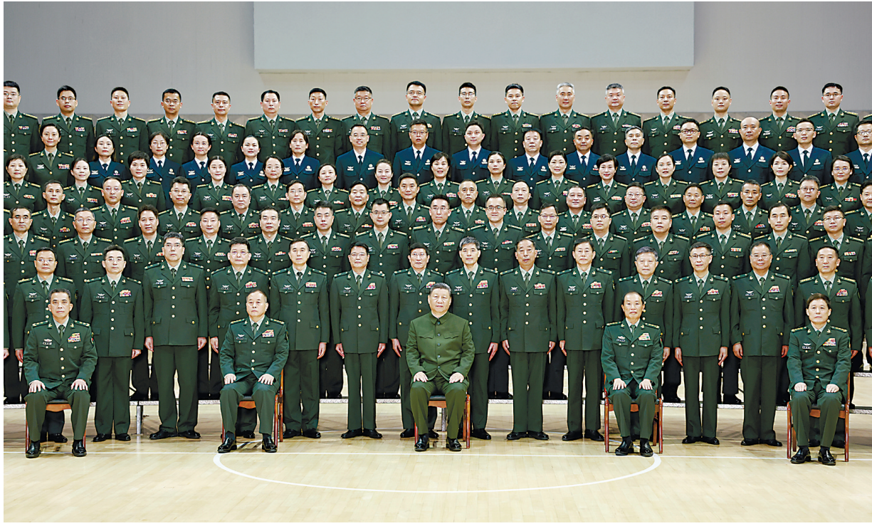
4月23日，中共中央总书记、国家主席、中央军委主席习近平到陆军军医大学视察。这是习近平亲切接见陆军军医大学官兵代表。