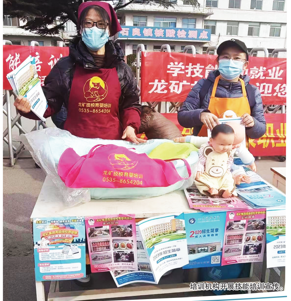
培训机构开展技能培训宣传。

“我今年46岁,没有工作,能去学月嫂吗?”“我想学小儿推拿,收费吗?”“家政行业现在一个月收入能有多少?”日前,在龙口市石良镇庙会上,一个特殊的摊位吸引了众多群众驻足围观、咨询,“吸粉”无数。 当天,龙口市人社局充分利用农村大集、庙会上农民聚集、人流量大的有利时机,组织职业院校、培训机构“摆摊设点”集中开展“2024年龙口市人社技能培训,促就业政策下乡惠民”主题宣传,并现场进行招生。龙口市人社局和培训机构的工作人员通过政策宣讲、现场互动、发放宣传彩页等方式,耐心细致地为过往群众讲解培训政策、工种,介绍培训机构位置、联系方式等信息。 “婴儿喂奶后如果不拍嗝容易呛着,拍嗝的时候要注意不要拍孩子的腰……”母婴护理中婴儿的拍嗝、包被子、婴儿操等具体的婴儿护理方法,吸引了众多宝妈和准宝妈们的兴趣。 保健按摩的老师一边为老人进行头部按摩,一边认真地讲解按摩方法,有实效的按摩手法缓解了老人头疼的顽疾,吸引了大量的农民工咨询和报名学习。 在现场,培训机构的讲师通过“体验式”“沉浸式”的讲解方式,让赶集会的群众了解了就业培训的“科技含量”。来自石良镇东埠村的女王士表示,子女已经成家,地里的活不多,又非常喜欢小孩子,也有带孩子的经验,想学习月嫂知识,为家里多增添一份收入。听了老师的讲解后,她立即报了名。更让她感到欣喜的是,培训机构不仅提供免费的就业培训,还可以帮助联系就业,一名优秀月嫂的月薪能达到1万元左右。 一上午的宣传取得显著成效,96名农民现场与培训机构现场达成培训协议,培训内容涵盖保健按摩、母婴护理、维修电工等5个工种,让老百姓在家门口就享受到“送上门”的培训服务。如今,龙口市人社局紧扣乡村振兴人才培训的主旋律,转变工作模式,把等学员上门培训变成送培训下乡,把课堂直接送到百姓的家门口,先后利用赶集、庙会、节假日等机会,把培训送到农村、社区、企业和学校。同时,结合乡村实际,开设非遗线编、无人机驾驶、直播带货等热门课程,为群众定制个性化的培训方案。(王军华 曲有颂 单楚瑜)