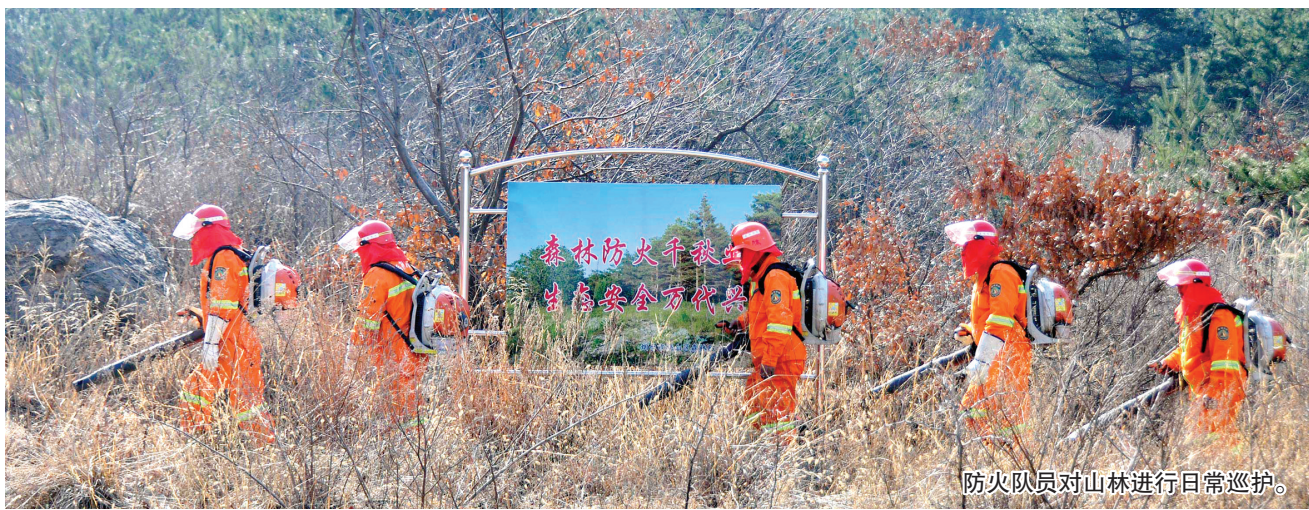
防火队员对山林进行日常巡护。

森林防火期间,全市相关部门坚持“大数据+铁脚板”,加快推进森林防火由“人工防”“传统防”向“科技防”“数字防”转变。目前,烟台市森林防火“一个码”已完成搭建,并在全市2797个防火卡口布设,通过扫码自动获取进出山林人员姓名、身份证号、手机号码以及进山原因、进山时间等信息,实现对进出山林人员的精准管控,守住第一道防线。搭建森林防火巡查“一个系统”,为解决护林房、检查站等检查要素位置不掌握、路线不熟悉等问题,研发了森林防火巡查巡检系统,精准定位5000余个目标,有效推动暗访巡查、靶向督导,实现从隐患排查到处置的闭环管理。搭建视频监控“一平台”,汇集全市900多路高点视频监控,可全天候查看实时、高清的可见光及热成像视频画面,发现火情及时预警。安装5594个防火卡口视频监控,具