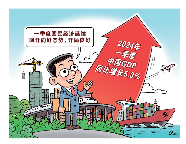
开局良好 新华社发 徐骏 作

消费是拉动经济增长的主引擎。一季度，社会消费品零售总额120327亿元，同比增长4.7%。消费对GDP增长的贡献率为73.7%，对经济增长发挥了重要的支撑作用。 服务消费增长较快，线上消费持续强劲，消费新动能持续释放。一季度，居民服务性消费支出占比43.3%，比去年同期提高1.6个百分点。全国网上零售额33082亿元，同比增长12.4%。其中，实物商品网上零售额28053亿元，增长11.6%，占社会消费品零售总额的比重为23.3%。 绿色消费深入人心，新能源车销售强劲。根据中国汽车工业协会的