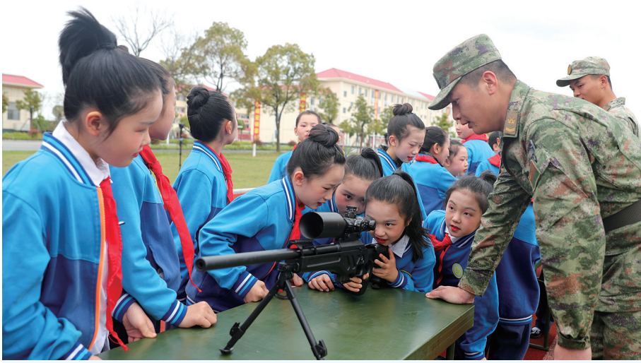
4月12日，陆军第72集团军某旅开展“百名学子进军营、同心共筑国防梦”国家安全教育主题活动，学生们在官兵指导下近距离体验单兵武器装备。

在云南德宏芒市机场，民警组织开展“出境前的国家安全课”，向乘客介绍当前国家安全局势、总体国家安全观相关内容，以及出境后的重点注意事项，提升我出境公民在海外保护人身财产安全、自觉维护