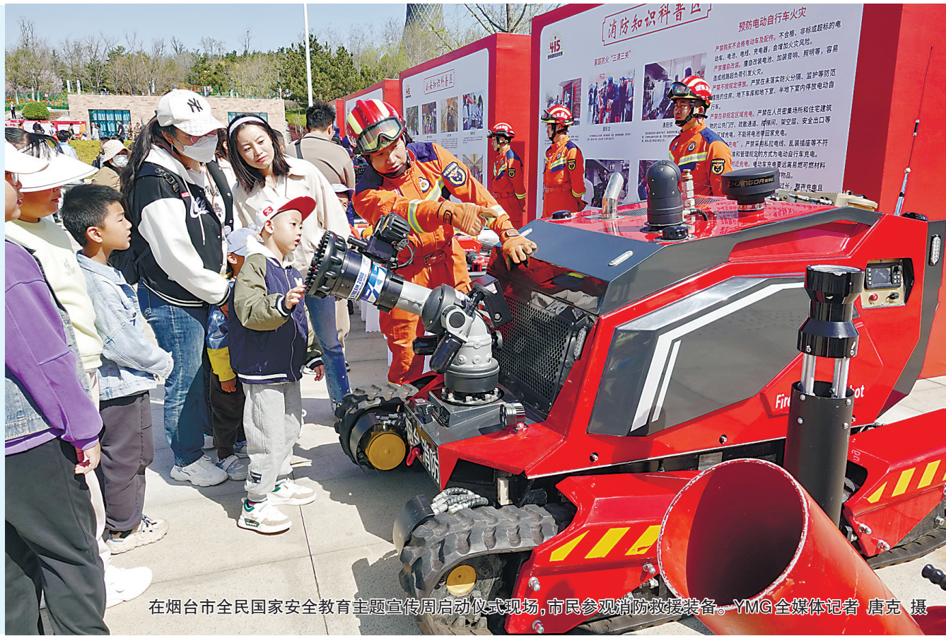
在烟台市全民国家安全教育主题宣传周启动仪式现场，市民参观消防救援装备。

2024年是习近平总书记提出总体国家安全观10周年。本次活动以“总体国家安全观 创新引领10周年”为主题，旨在深入贯彻落实总体国家安全观，进一步增强广大干部群众全民国家安全隐患和素养。此次活动，通过主题展览、文艺展演、应急演练等群众喜闻乐见的方式，“面对面、零距离、互动式”立体化宣传国家安全，吸引了广大群众积极参与。现场群众纷纷表示，国家安全人人有责，每个人都应该肩负起维护国家安全的责任。