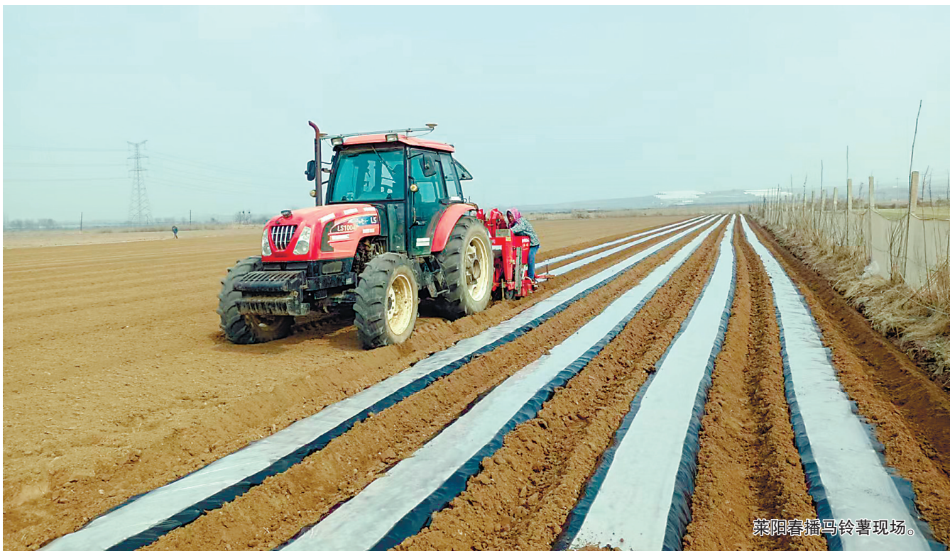
莱阳春播马铃薯现场。