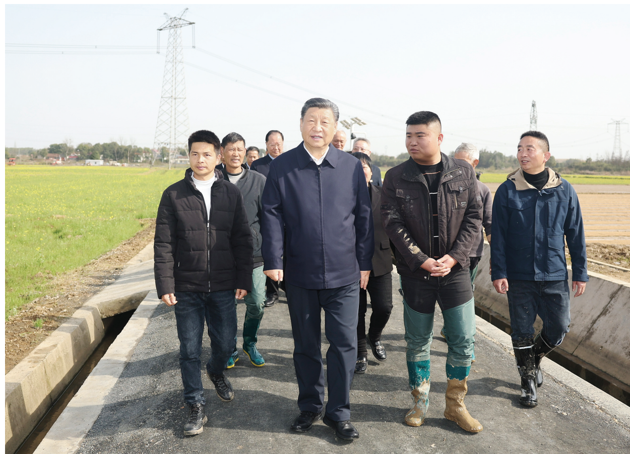
3月18日至21日，中共中央总书记、国家主席、中央军委主席习近平在湖南考察。这是19日下午，习近平在常德市鼎城区谢家铺镇港中坪村，同种粮大户、农技人员、基层干部亲切交流。

新华社长沙3月21日电 中共中央总书记、国家主席、中央军委主席习近平近日在湖南考察时强调，湖南要牢牢把握自身在构建新发展格局中的战略定位，坚持稳中求进工作总基调，坚持高质量发展不动摇，坚持改革创新、求真务实，在打造国家重要先进制造业高地、具有核心竞争力