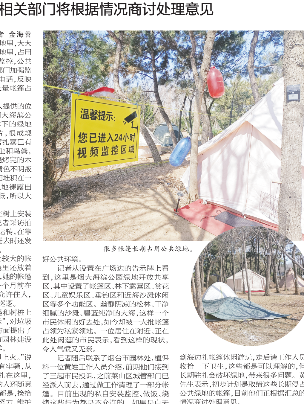
很多帐篷长期占用公共绿地。

本报讯(YMG全媒体记者 金海善 摄影报道)“烟大海滨公园的绿地上,大大小小的帐篷长期驻扎在树下绿地上,占用公共空间,树上还私自安装了监控,公共区域成了私家领地,呼吁有关部门加强监管。”近日,多名市民打来热线电话,反映滨海中路烟大海滨公园存在大量帐篷占用公共绿地的现象。 昨日上午,记者根据爆料人提供的位置,找到了位于滨海中路的烟大海滨公园,在靠近海边一侧的松树林下的绿地上,大大小小的帐篷连成一片,很成规模。可以看出这些帐篷都安营扎寨有些时日,有的帐篷上落满了灰尘和鸟粪,有的帐篷门前的树底下倒有烧烤完的木炭灰,有的门前树旁放着装有黄色不明液体的瓶子,有的地方松针被清扫堆积在一起。因过度踩踏,不少地方土地裸露出来。昨天是工作日,气温又较低,所以大部分的帐篷里没有主人。 为保护自己的帐篷,有人在树上安装了监控和太阳能照明设施。记者采访拍照时,看到这些监控摄像头在运转,在靠近里侧的一片帐篷区,记者走进时还发出了节奏紧张的电子警报声。 在靠近广场一侧的一顶比较大的帐篷里,一位女士正在做饭,帐篷里还放着个液化气钢瓶。她告诉记者,她的帐篷是花了5000多元买的,她是一个月前在这里扎下帐篷的,这里晚上不允许住人,傍晚的时候会有工作人员过来巡逻。 记者在现场看到,一些帐篷和树桩上贴着用A4纸打印的“温馨提示”,对垃圾清理、电器使用、烧烤、摆摊等方面提出了具体的要求,下面落有“烟台市园林建设养护中心2024年3月6日”字样。 “也管不了他们,只能心里上火。”说起这些帐篷,一位保洁大姐颇有牢骚,从去年夏天开始,他们就长期驻扎在这里,每天增加了很多生活垃圾,有的人还随意放置,遇到大风天气,刮得到处都是,收拾都来不及,她希望大家能共同努力,维护