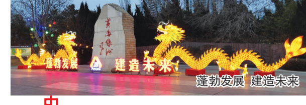
蓬勃发展 建造未来