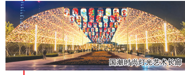
国潮时尚灯光艺术长廊