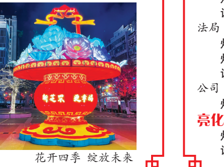
花开四季 绽放未来