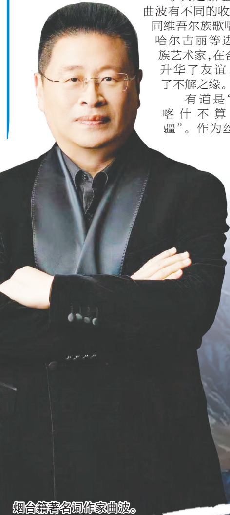
烟台籍著名词作家曲波。