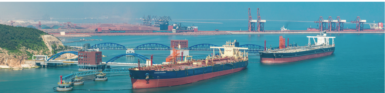
航拍烟台港西港区601泊位和602泊位。

“因为责任所以坚持,因为热爱所以无悔。”对烟台港引航站的引航员们来说,当初抉择之时,就坚定了扎根蓝海不懈奋斗的理想与信念。顾大局、识大体,舍小家、为大家,讲奉献、敢担当,坚守岗位,奋战在烟台港前线,为巨轮安全进出港保驾护航,他们用无私书写了龙年春节的“敬业福”。(张孙小嫒 刁翔宇)