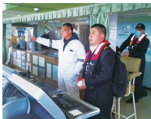
引航员指挥船舶进港。

“因为责任所以坚持,因为热爱所以无悔。”对烟台港引航站的引航员们来说,当初抉择之时,就坚定了扎根蓝海不懈奋斗的理想与信念。顾大局、识大体,舍小家、为大家,讲奉献、敢担当,坚守岗位,奋战在烟台港前线,为巨轮安全进出港保驾护航,他们用无私书写了龙年春节的“敬业福”。(张孙小嫒 刁翔宇)