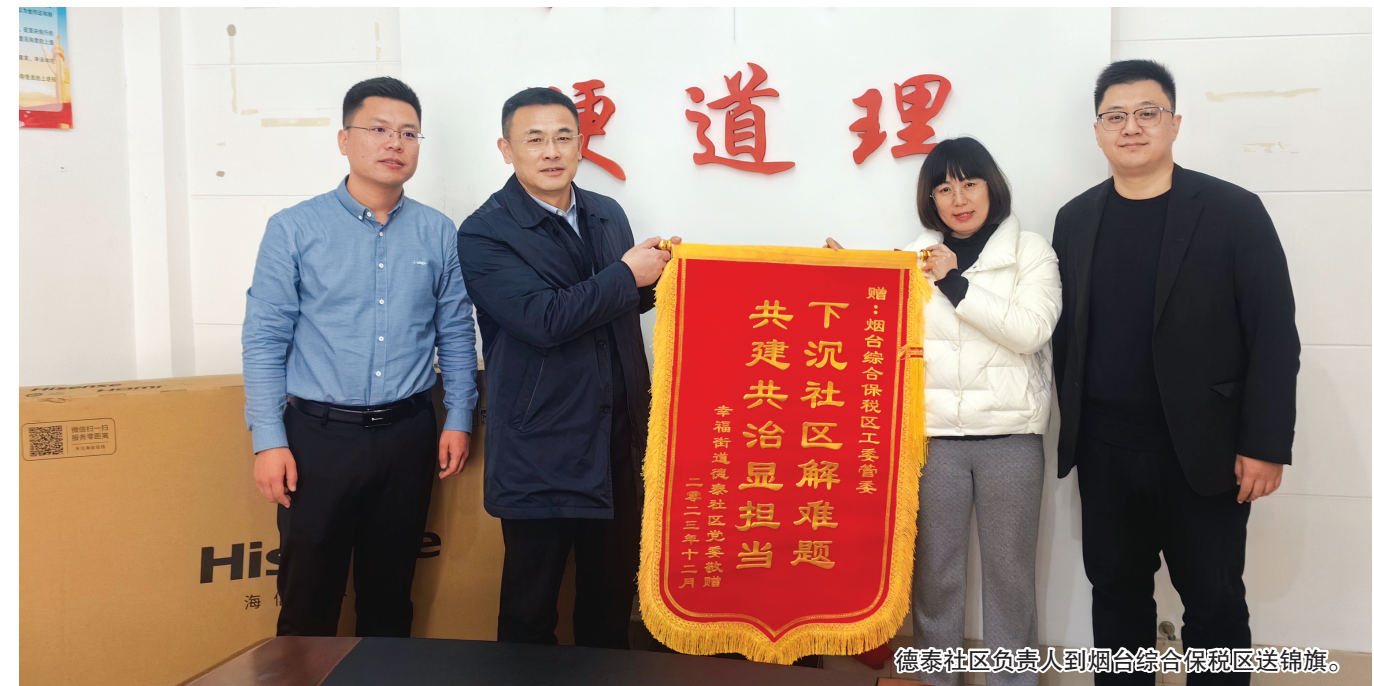
德泰社区负责人到烟台综合保税区送锦旗。

在民生服务领域,综保区工委“双报到”党员带着米、面、油和礼盒来到德泰社区走访8户困难党员、困难家庭、低保弱势群体,为他们及时送去关怀与温暖;搭建