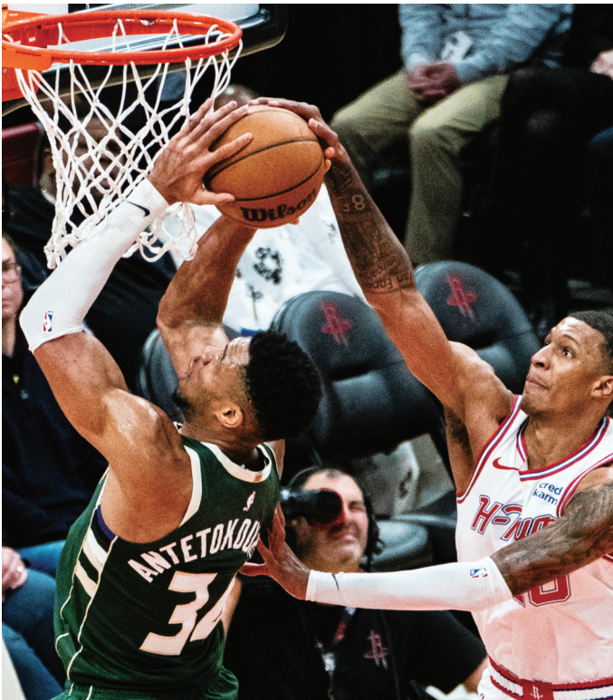
1月6日，火箭队球员贾巴里·史密斯(右)在比赛中防守雄鹿队球员安特托昆博。当日，在2023—2024赛季NBA常规赛，休斯敦火箭队主场112比108战胜密尔沃基雄鹿队。

芝罘区体育运动服务中心负责人表示，他们将深化1+N赛事组织模式，广泛开展羽毛球、篮球、足球等赛事，打造“活力芝罘”赛事品牌，支持区级协会、社会力量承办省市级以上高水平赛事，提升全民健身赛事水平，在全社会营造崇尚健身、参与健身、追求健康文明生活方式的良好风尚。