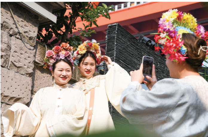
重庆市南岸区将龙门浩老街打造成既有厚重历史文化底蕴、又具备现代时尚元素的老街,受到市民和游客青睐。