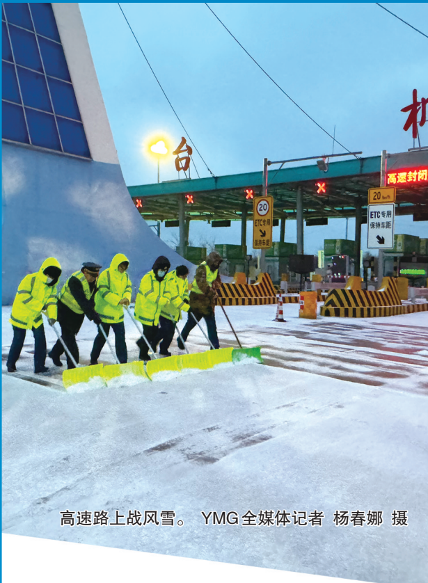
高速路上战风雪。