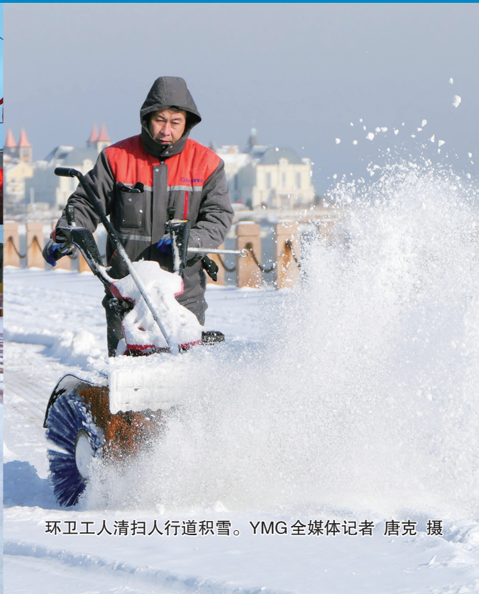
环卫工人清扫人行道积雪。