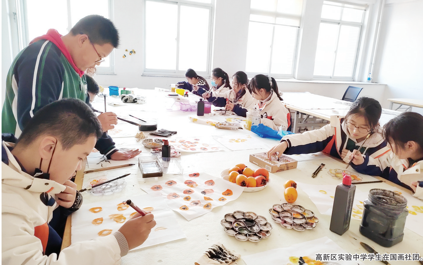
高新区实验中学学生在国画社团。

以实效促发展、以创新铸特色、以特色创名校,烟台高新区实验中学正昂扬奋进的崭新风貌奔向未来。