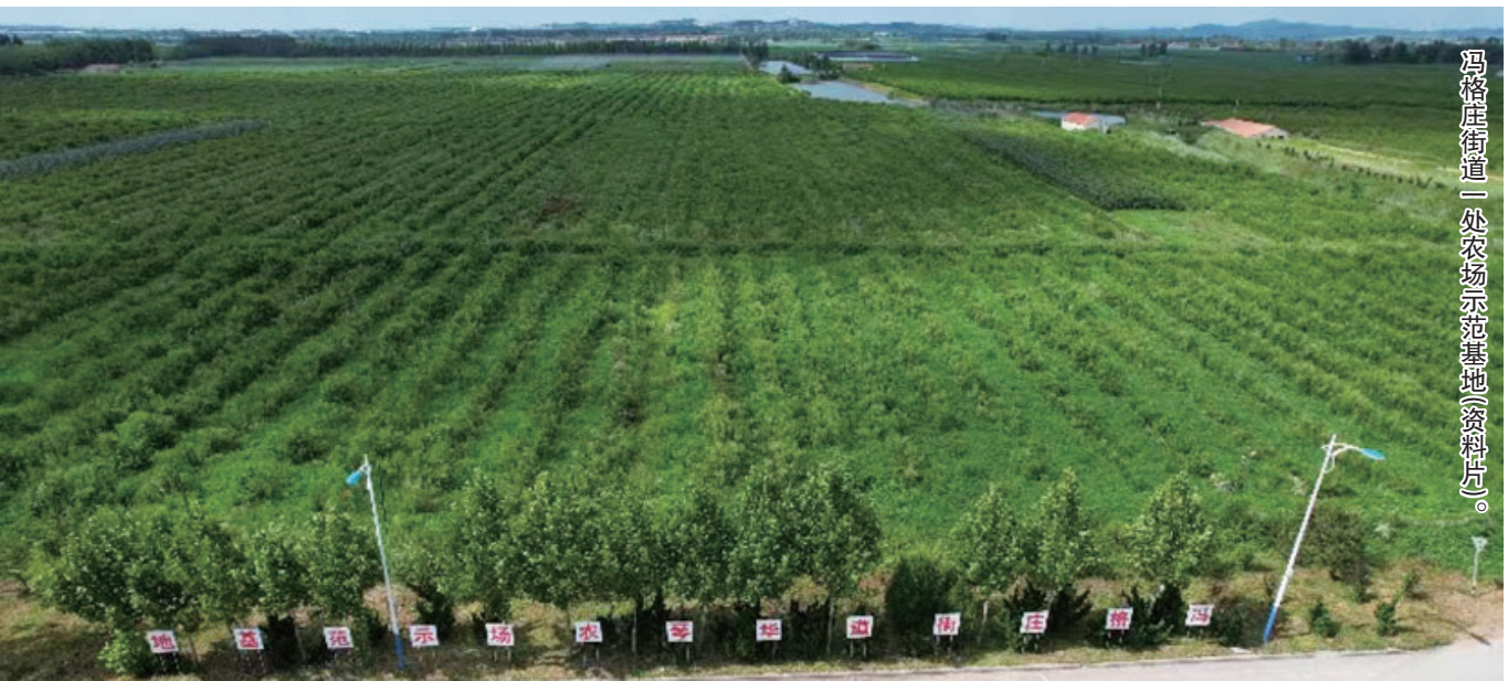
冯格庄街道一处农场示范基地资料片。

近年来，莱阳市冯格庄街道以党建为引领，以深化体制改革为支撑，以完善工作机制为基础，以创新治理模式为保障，持续推进社会治理高质量发展走在前列，逐步探索出一条党建引领、共享共治的乡村“智理”新路径。