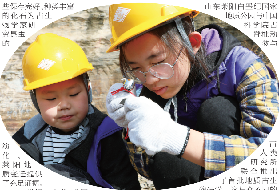
演化、莱阳地质变迁提供了充足证据。

作为世界古生物科考的圣地，莱阳是一座名副其实的地质古生物之城，而在莱阳西南边，又有这样一个村庄，它矗立在一块亿年前的土地上，容纳了一个神秘的古昆虫王国。 这就是莱阳市团旺镇南李格庄村，是莱阳重要的化石产地之一，是我国昆虫化石研究的发源地，这里埋藏的化石数量众多，类型丰富，包括昆虫、植物、鱼类化石等，是中国古生物科考的重要地点，更是莱阳地质生物研学的“特别课堂”。 站在这片古老的土地上，顺着高低起伏的地形，似乎能看到：1.15亿年前，这里是一片湖泊，水草丰茂，为昆虫提供了得天独厚的栖息环境，吸引了大大小小、种类繁多的昆虫聚集于此。在这些昆虫中，不断上演着“物竞天择”的一幕，随后，长肢裂尾甲这种颇为凶猛的肉食昆虫在一众史前“怪虫”中异军突起，成为当时昆虫食物链的顶端。直到现在，通过大大小小的化石，我们依然能清晰地看到它长长的前肢像尖刀一样锋利，好像轻易就能擒住那些大大小小的昆虫，然后挥动它的“餐刀”愉快地进食。而当它饱餐一顿正要休息时，泥石流突然降临到这片终年湿热的红色大地上，顷刻间，天翻地覆，霸主亦归于泥土。 在接下来的上亿年间，无论是食物还是霸主，在岁月的沉淀中，悄无声息地改变着。昆虫的外骨骼、翅脉、足都被完整地保存下来，成为历史中永恒的刻痕。这