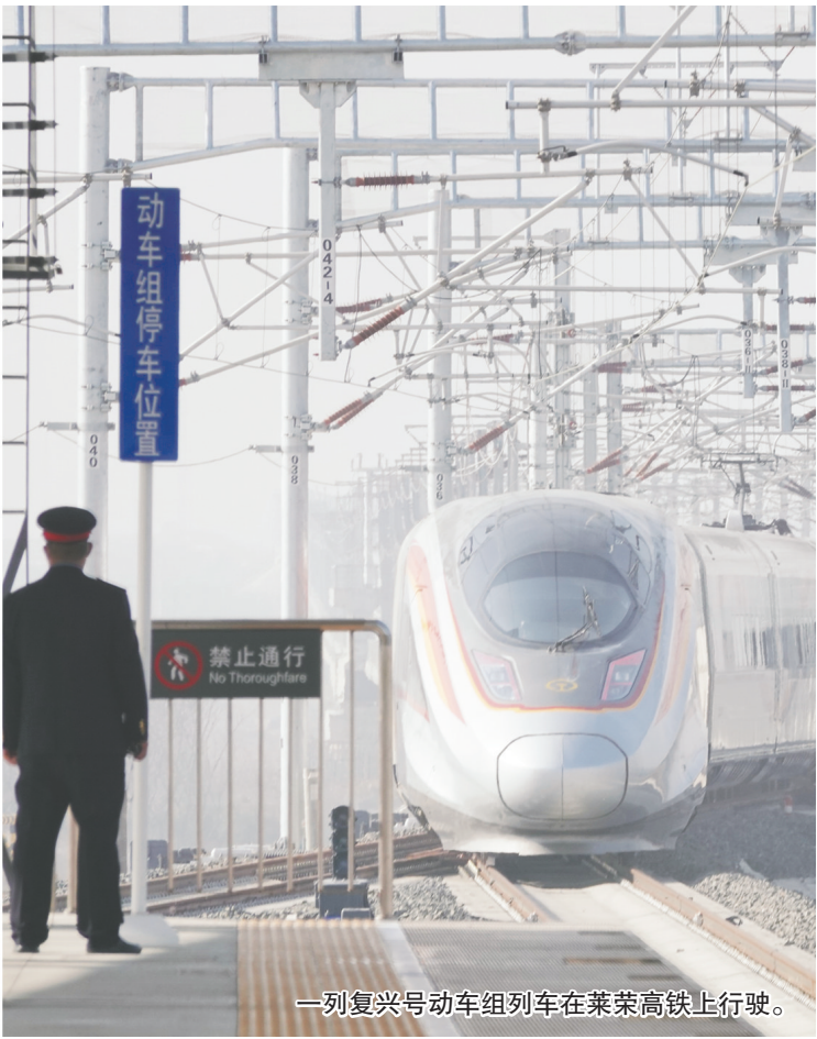
一列复兴号动车组列车在莱荣高铁上行驶。