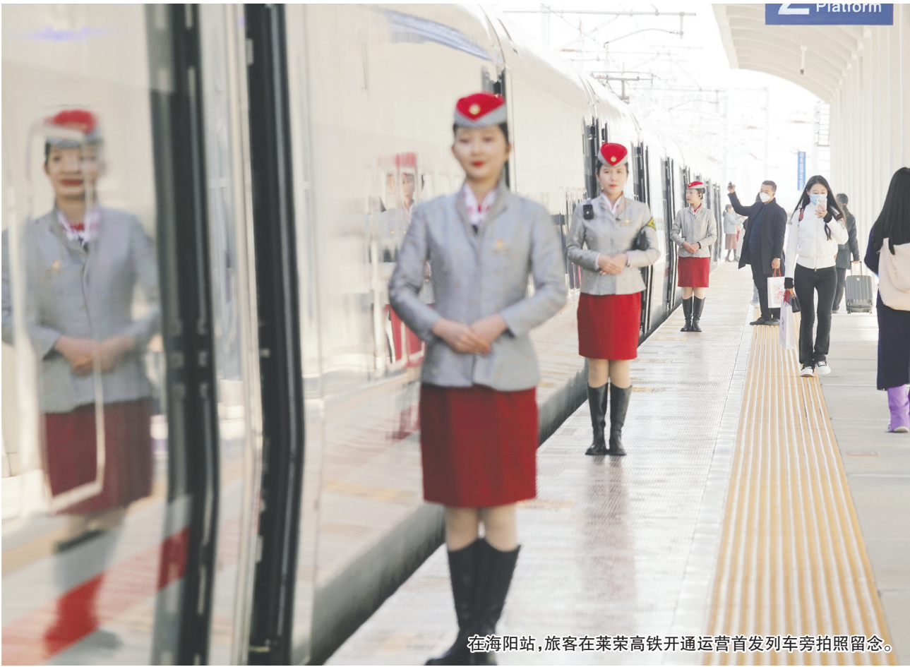
在海阳站,旅客在莱荣高铁开通运营首发列车旁拍照留念。

历时1114个日日夜夜,12月8日,莱荣高铁全线通车。至此,全国路网短板得以补齐,胶东半岛地区从“动车”时代阔步迈进350km/h“高铁”时代。 处于山东半岛蓝色经济区核心区域、烟青威中心节点的海阳市,汇聚青岛、烟台、威海三大国际海港、空港,拥有国家一类开放口岸——海阳港,青荣城际、蓝烟铁路、荣潍高速、威青高速、文莱高速纵横交错。青岛至海阳市域铁路列入国家发展规划,莱荣高铁通车后,将实现半岛1小时,省内2小时,与北京、上海等中心城市4小时快速交通圈。此外,海阳港东港区、国道228等重大工程高效推进,海阳加速融入山东半岛城市群。 以互联互通为方向,以轨道交通为主体,以农村基础设施为补充,为构建一体化、广覆盖的交通网络,海阳市全面启动交通强国试点工作。围绕建设立体互联的综合交通网络、建设便捷高效的运输服务、建设安全可靠的安全应急、建设智慧引领的创新发展、建设集约节约的绿色交通、建设现代完善的行业治理“六大体系”建设,实施建设“轨道上的海阳”、建设多功能综合性港区、干线公路提质、“四好农村路”乡村振兴暨文旅融合、交通可持续发展、提升治理能力等“六大专项行动”,编制完成《加快建设交通强国山东示范区烟台海阳市行动方案(2022—2025年)》,不断探索交通强国山东示范区建设试点“海阳经验”。