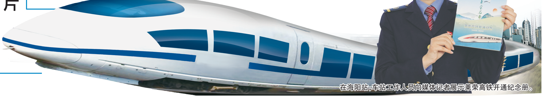
在海阳站,车站工作人员向媒体记者展示莱荣高铁开通纪念册。

目前,该项目正在进行前期论证及相关手续办理工作。项目建成后,将有利于构建海阳市航天、航空产业一体化布局,有利于海阳市第三产业的发展,推动海阳打造集航天发射观礼、航天健康疗养、航空文化娱乐、航空休闲运动、航天航空科普、航天航空育种产业化于一体的中国首个航天航空文旅休闲城市。