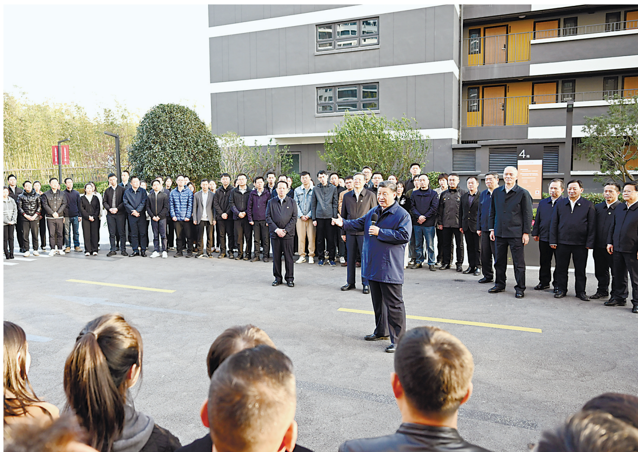
11月28日至12月2日，中共中央总书记、国家主席、中央军委主席习近平在上海考察。这是11月29日下午，习近平在闵行区新时代城市建设者管理者之家，同社区居民亲切交流。