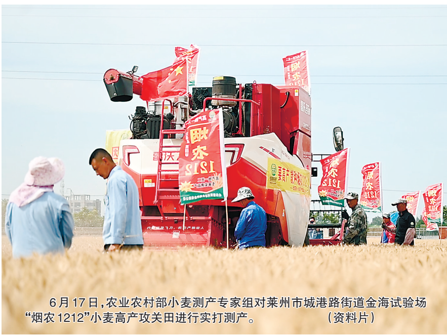
6月17日，农业农村部小麦测产专家组对莱州市城港路街道金海试验场“烟农1212”小麦高产攻关田进行实打测产。

“烟农1212”“烟农29”由烟台市农科院小麦育种团队选育。其中，“烟农1212”具有超高产、抗旱、抗寒、抗病、抗倒伏、抗干热风 and 适应性广的突出优点，已通过国家黄淮北片、黄淮南片、山东省、河北省冀中北和冀中南审定，天津市