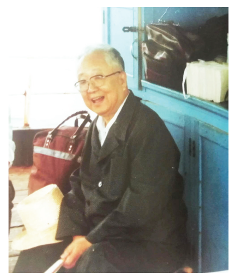
启功先生在烟台留影。(资料片)