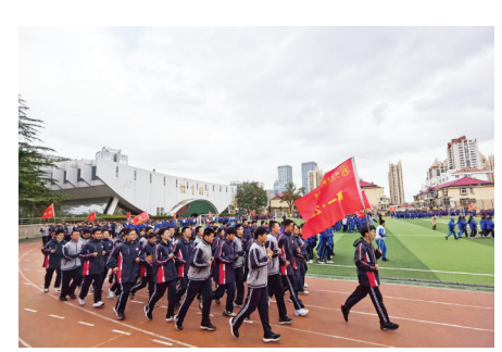
朝气蓬勃的烟台二中学子。