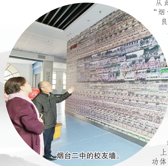
烟台二中的校友墙。