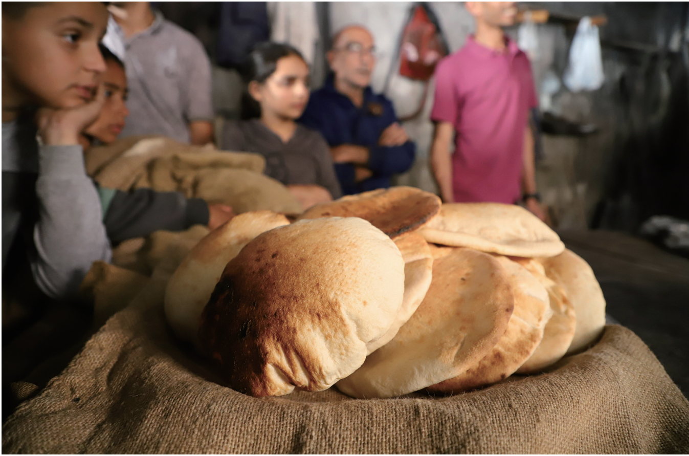
这是11月9日在加沙地带南部城市汗尤尼斯拍摄的待售卖的大饼。联合国等组织多次警告，加沙地带的医院超负荷运转，已无力救治大量伤员，而且缺乏食物和干净的水。

为进一步推进招远市辛庄镇招商工作，发挥人才优势，赋能经济发展，近日，辛庄镇组织赴中国科学院兰州化学物理研究所开展人才交流活动。该镇相关负责人与中国科学院兰州化学物理研究所环境材料与生态化学研究发展中心副主任、中国科学院兰州化学物理研究所副研究员等专家学者就新材料开发、技术转化、人才承接等方面做对接。会上，镇相关负责人介绍了辛庄镇经济社会发展情况、产业发展现状及人才需求，希望双方不断加强交流合作，全面拓宽合作领域，增强人才互通、优势互补、资源互享，切实推动科技成果落地转化、产业提质增效，为乡村振兴、产业发展注入强劲动力。（李君妍）