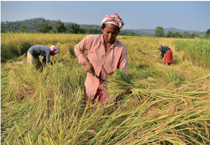
11月5日，农民在印度阿萨姆邦的稻田里收获稻谷。