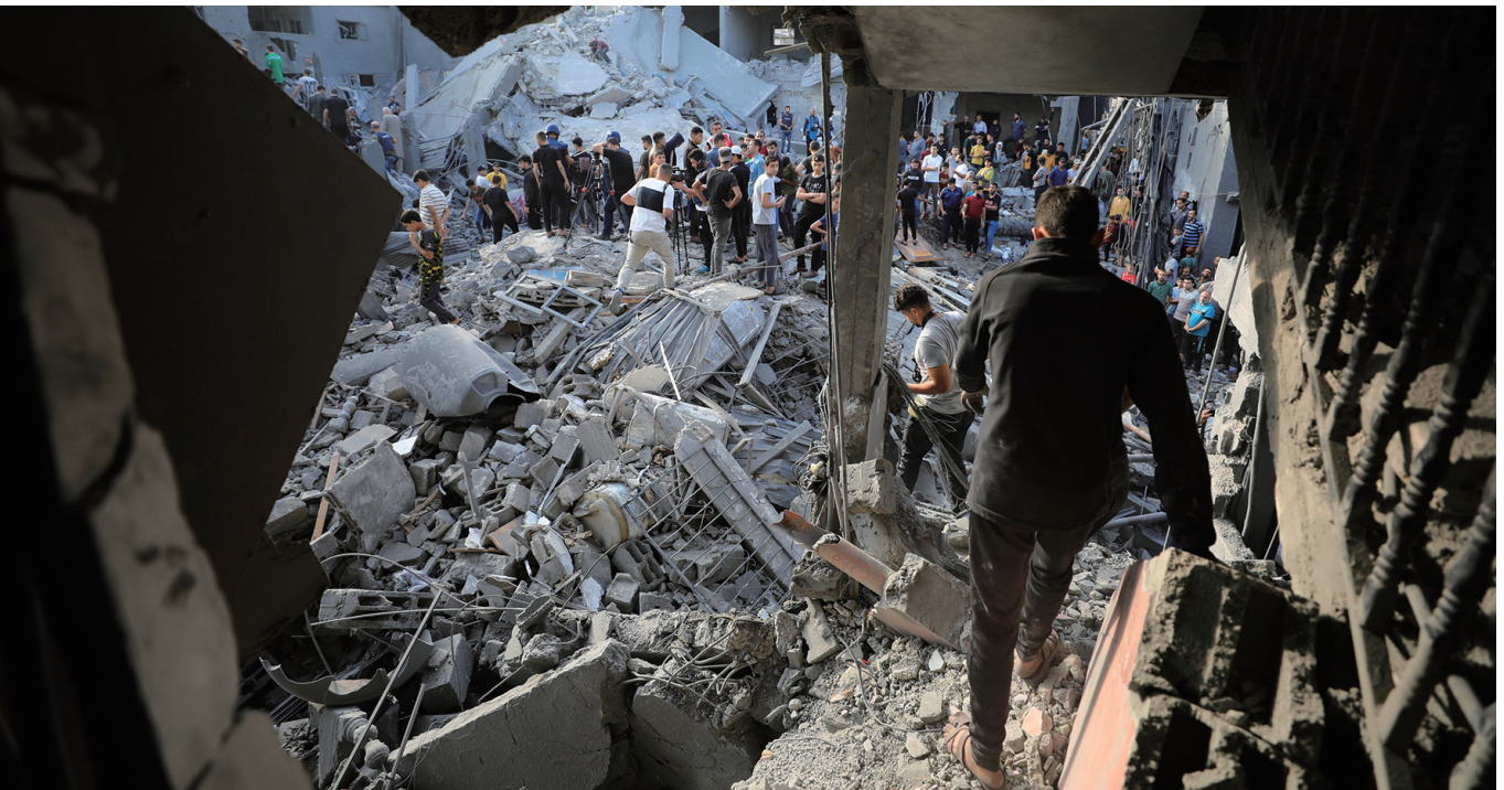
11月5日，在加沙地带中部的代尔拜拉赫，人们查看遭以色列轰炸后的迈加齐难民营。