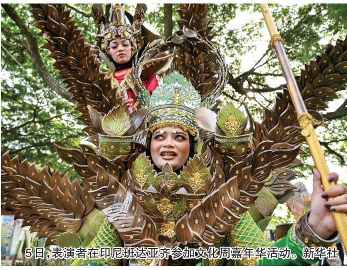
5日，表演者在印尼达亚齐参加文化周嘉年华活动。

据介绍，多元而丰富的历史文化遗产是摩洛哥的一大特色。首都拉巴特不仅是全国政治、文化和金融中心，同时还拥有哈桑塔、拉巴特王宫、乌达雅堡等众多历史名迹。