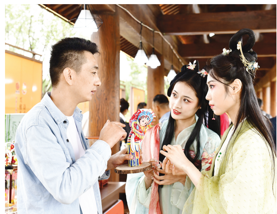
2023年9月26日,在第九届尼山世界文明论坛“山东手造”精品展区,与会人员在介绍国家级非遗曹州面人作品。

“对话”“交流”“共同”“多元”……梳理历届尼山世界文明论坛的主题,可以发现这些关键词。不同文化背景的专家学者围绕这些关键词一次次进行思想碰撞,并逐渐达成共识:尊重、交流、平等、互鉴,是不同文明和平共存、共同发展的方式。 本届论坛主题为“全人类共同价值与人类命运共同体——加强文明交流互鉴共同应对全球挑战”,下设“全人类共同价值诉求与当今世界面对的新挑战”“中华优秀传统文化与全人类共同价值”等12个分论坛。 “在世界各国前途命运紧密相连的今天,第九届尼山世界文明论坛主题仍将致力于实现不同文明包容共存、交流互鉴。”尼山世界儒学中心副主任刘廷善说。 当前,世界之变、时代之变、历史之变正以前所未有的方式展开,人类社会面临前所未有的挑战。 与会专家学者认为,历届尼山世界文明论坛的主题设置都蕴含着强烈的现实关怀,致力于探讨应对当下人类文明进步中最迫切需要解决的问题。本届论坛聚焦全人类面临的共同挑战和构建人类美好未来,将为解决人类面临的共同问题探索可行方案。 清华大学国学研究院院长陈来等专家认为,尼山世界文明论坛倡导弘扬全人类共同价值,主张以宽广胸襟实现不同文明交流对话、吸收借鉴一切人类优秀文明成果,强调以团结化解分裂、以合作回答对抗、以包容代替排他。 文明因交流而多彩,文明因互鉴而丰富。 “世界上有多种文化和文明,都是人类社会的宝贵财富,要理解不同文明之间的差异,欣赏它们形成的多彩之美,这需要既坚持自身文明传统,又对其他文明持开放包容的态度。”国际儒学联合会副会长、山东大学儒学高等研究院执行院长王学典说,只有加