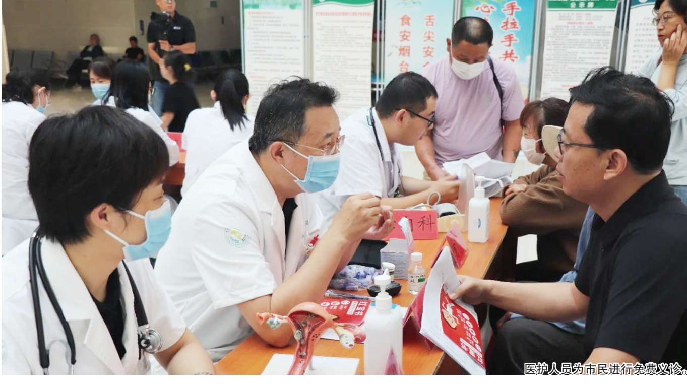
莱州市人民医院开展2023年“服务百姓健康行动”大型义诊活动

9月20日，莱州市人民医院积极响应2023年“服务百姓健康行动”全国大型义诊活动周相关要求，在门诊楼一楼大厅举办大型健康义诊活动，进一步增强群众健康意识，不断提升群众幸福感。