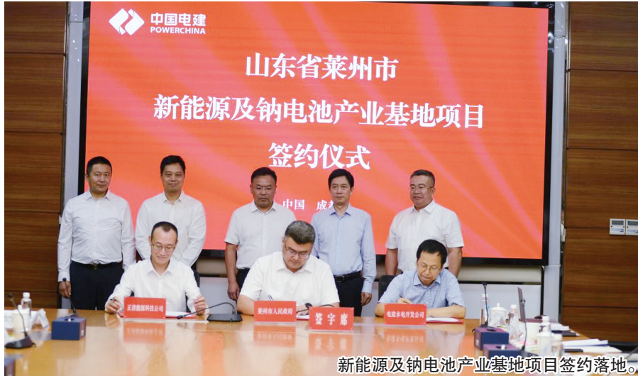
莱州市招商团赴深圳、成都、南京等地开展招商活动，积极对接企业、主动寻求合作商机，聚焦聚力招大商、招优商、招好商，以招引实效为经济社会发展加码添力。

9月13日，莱州招商团走访了中电建水电开发集团公司，观摩了中电建水电开发集团运维集控中心。随后与“三类”500