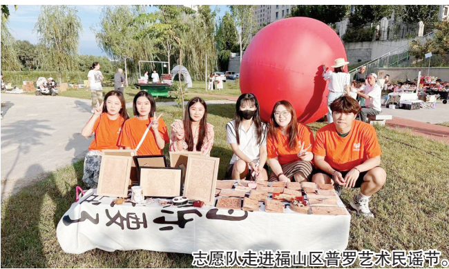
志愿队走进福山区普罗艺术民谣节。

本报讯(YMG全媒体记者 徐峰 通讯员 王敏 摄影报道)为弘扬中华民族文化自信,传承非遗文化,近日,烟台理工学院“强国有我”志愿队走进福山区普罗艺术民谣节,借此机会展示烟台理工学院大学生非遗皮雕作品。在民谣节现场,这一传统技艺激发了许多市民的兴趣。 在带队老师杨纪婷的指导下,志愿者们将文化内涵融入