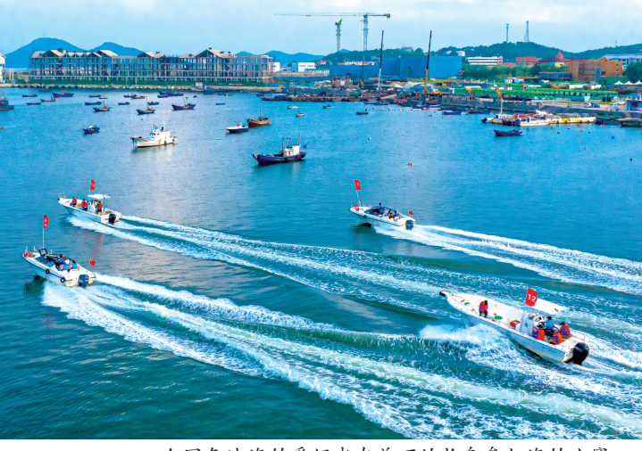
全国各地海钓爱好者在美丽的长岛参加海钓比赛。

比赛过程中,选手们各出绝招,各亮绝活,有的凭经验稳扎稳打,有的靠技巧奋勇争先,许氏平鲈、鲈鱼、牙鲈鱼等多种鱼频频上钩,小的三两斤,大的十余斤,让选手们收获满满,体验感十足。