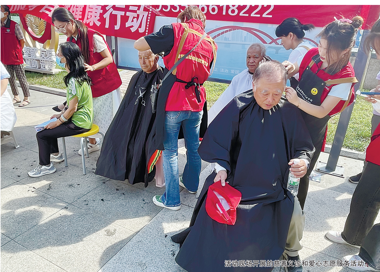
活动现场开展的慈善义卖和爱心志愿服务活动。

在慈善义卖区域,有爱心企业提供的精美童装、扬帆助学慈善义工服务队手工制作的芝麻丸、慈心助困服务队成员制作的串珠小玩偶、莱山区薪火传统文化公益服务中心带来的文具用品等,所有义卖收入均捐赠至市慈善总会账户,用于开展公益慈善活动。市慈善总会工作人员发放了宣传页,向市民展示了慈善义工服务项目宣传册、慈善救助项目宣传册及义工申请表等材料。福山区青年志愿者协会义工们向市民宣传志愿服务工作,积极争取更多市民加入慈善义工大家庭,营造“人人能慈善,慈善惠人人”的浓厚氛围。