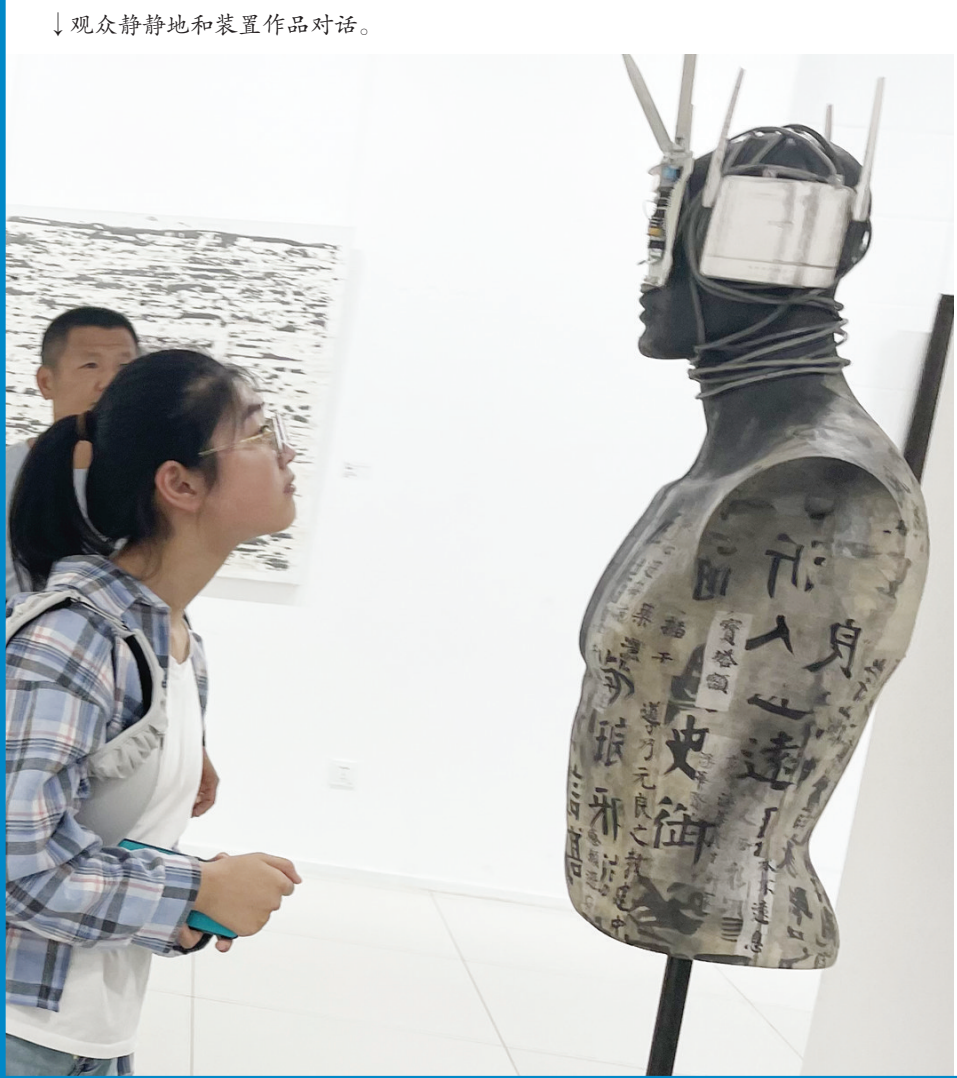
↓观众静静地和装置作品对话。