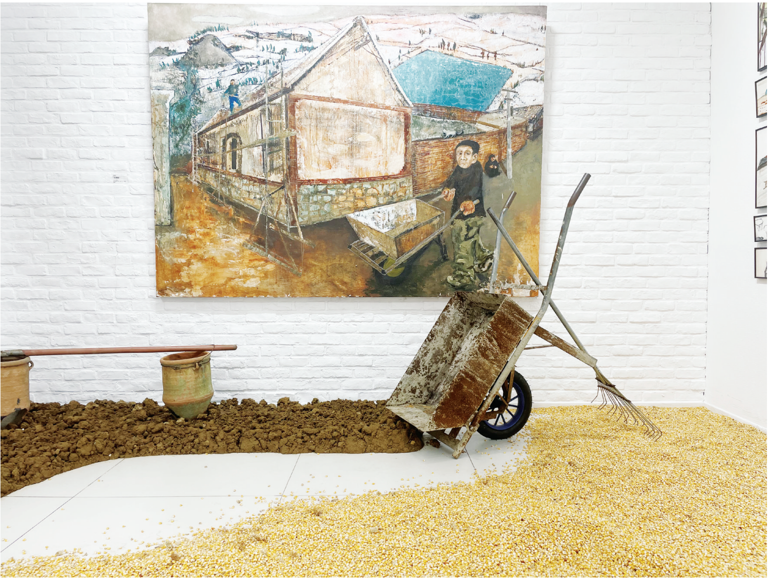
↑画里画外交相呼应,体验感顿生。