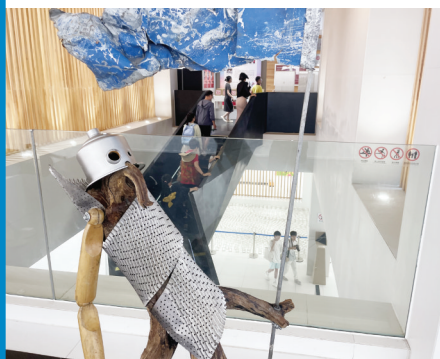
↑唐吉珂德和观众一道在展厅里游戏。