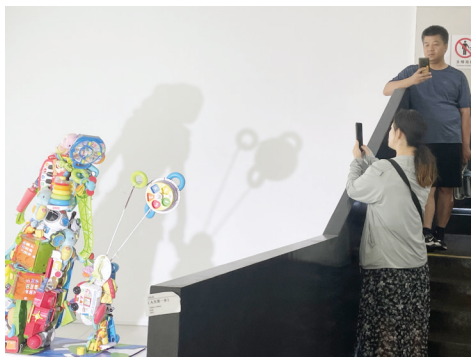
↑一些废弃的材质,却映射出不一样的意境,那一丝丝的联系耐人寻味。