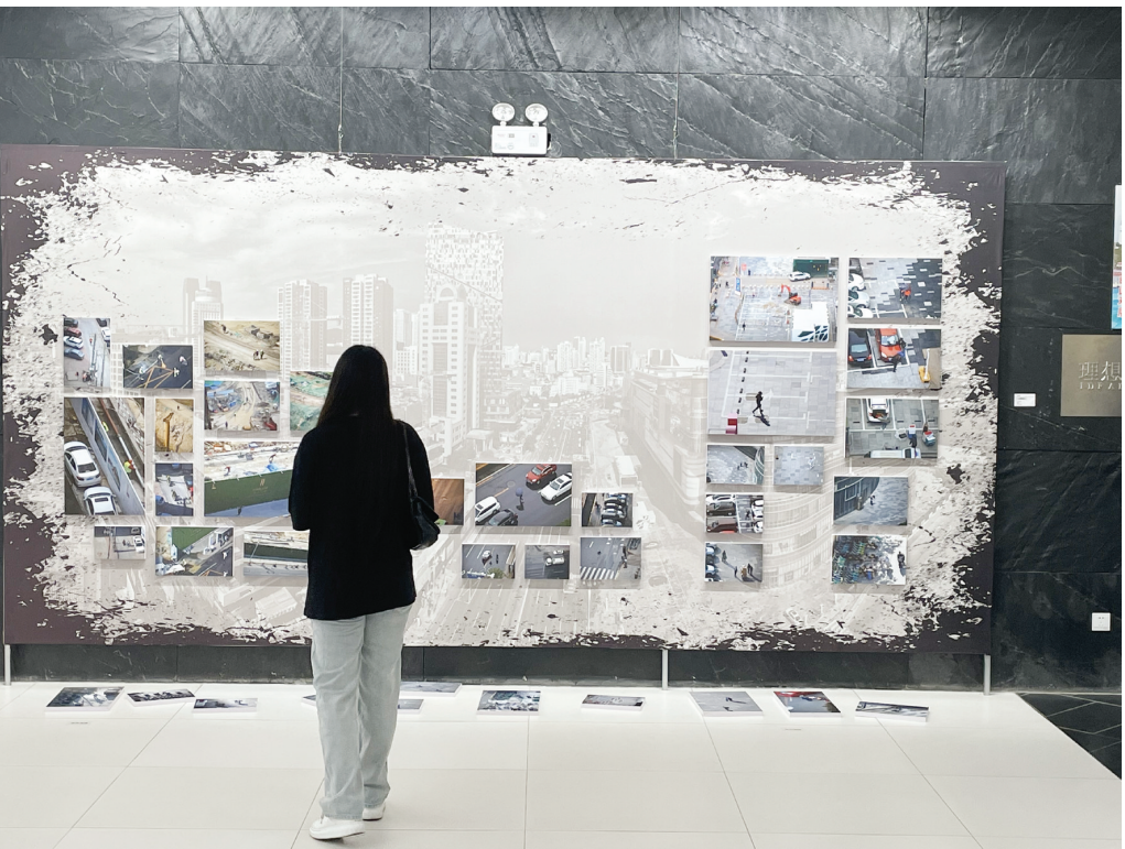
↑与众不同的展示方式,叙述着与众不同的故事。

烟台的当代艺术的开展有些年头了,我一直感叹这么一帮人执着于相对保守的艺术环境中,甘于寂寞,不断探索,直到去年被一组名为“纸孩子”的装置艺术惊艳,才不得不重新审视这些人以及他们的努力,并决定和他们并肩战斗。 8月4日,又一批新作品在烟台美术博物馆亮相,在炎炎夏日为港城吹进一缕缕清风。“新边界”,边界已经不重要,“新”才是灵魂。