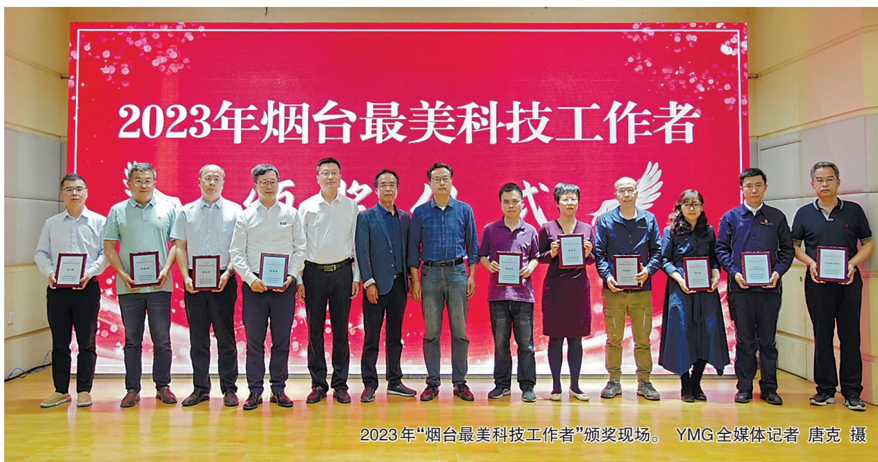
2023年“烟台最美科技工作者”颁奖现场。