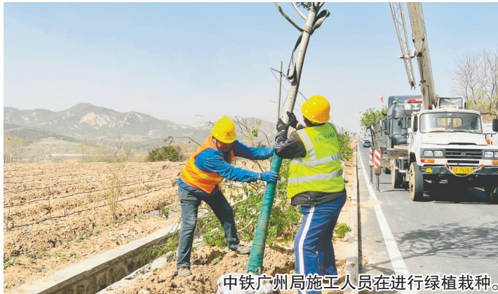
中铁广州局施工人员进行绿植栽种。

本报讯(YMG全媒体记者 唐寿锐 通讯员 王康 摄影报道)眼下,牟平区县乡道路X003上殿线绿化工程施工已经进入冲刺收尾阶段,园林工人正在补种地被植物。当前,牟平区抢抓有利天气,大力实施道路绿化及改造提升工程,厚植城乡生态底色,增加群众的幸福指数。