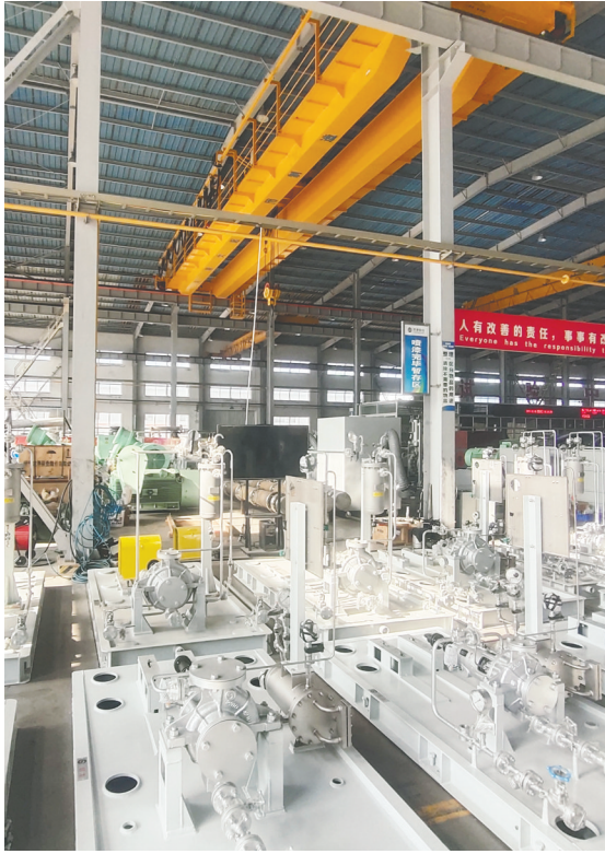
担保支持的龙港泵业股份有限公司生产车间。