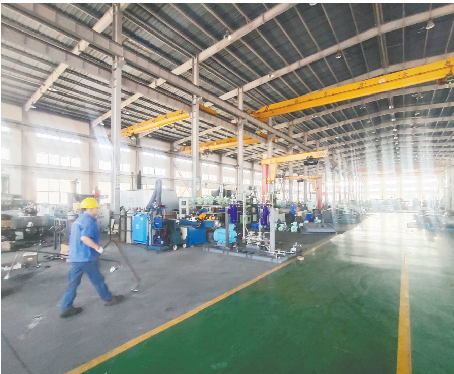
烟台融资担保集团运用“知识产权质押担保”,为烟台龙港泵业股份有限公司提供了500万元组合贷款担保,为其后续参与裕龙石化项目等市重点工程提供了资金支持。

一直以来,烟台高度重视企业上市工作,通过政策引导、服务创新、平台搭建、要素聚集,推动企业上市工作不断取得新突破。目前,烟台上市公司总数62家,累计实现直接融资近2500亿元,其中境内上市公司52家,总市值接近9千亿元,资本市场“烟台板块”加速崛起,成为推动地方经济高质量发展的生力军。上市公司创新联盟的成立,标志着烟台资本市场发展进入了新阶段,将为全市经济社会高质量发展增添新动能。