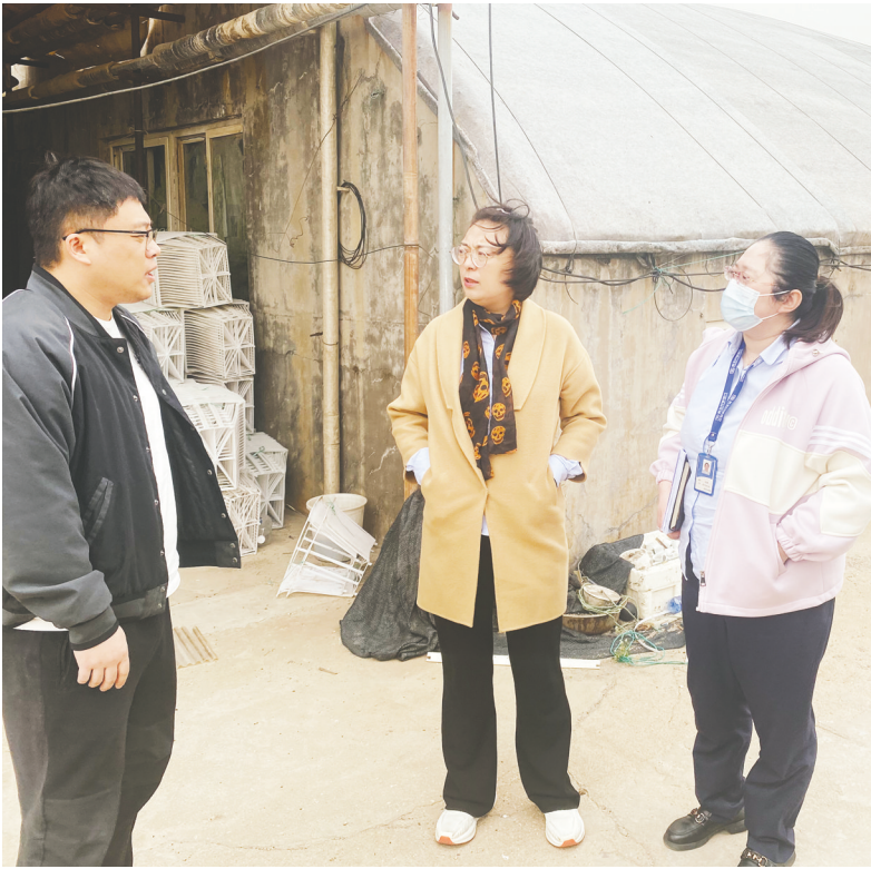
烟台融资担保集团深入田间地头,了解种植户、养殖户的资金需求。

在烟台冲刺“万亿之城”的征途上,烟台融资担保集团正持续充分发挥经济发展“稳定器”“压舱石”积极效应。