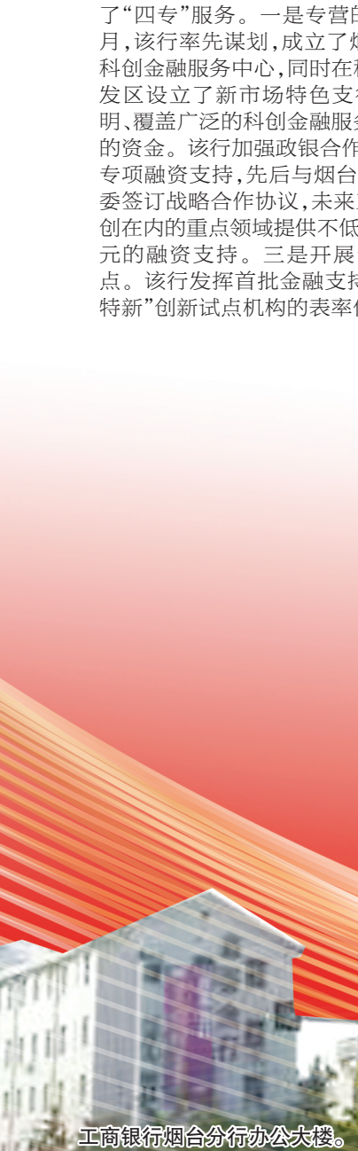
工商银行烟台分行办公大楼。

为者常成，行者常至。烟台工行将始终心怀国之大者，牢记国有金融企业的政治责任、经济责任和社会责任，继续以地方金融“主力军”的姿态，围绕服务新发展格局，深耕地方市场，强化创新服务，不断提升金融服务实体经济能力，在烟台经济社会高质量发展中贡献更多力量！ （杨渭）