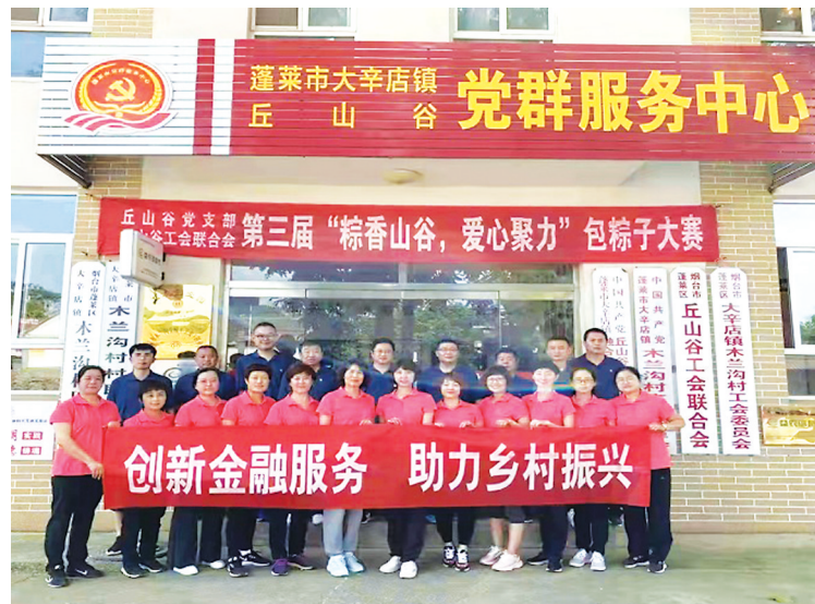
开展“创新金融服务、助力乡村振兴”主题活动。

在全面贯彻落实党的二十大精神的开局之年,在烟台实现地区生产总值过万亿目标的冲刺之年,5月9日,烟台工行传来喜讯,各项贷款突破1000亿元大关,创下历史新高,成为全市首家贷款“超千亿”的商业银行。千亿元贷款的成绩单,是该行与烟台区域经济发展同频共振的奋斗结果,是贯彻落实全市金融工作会议精神的具体举措,为烟台冲万亿之城贡献了“工行力量”。