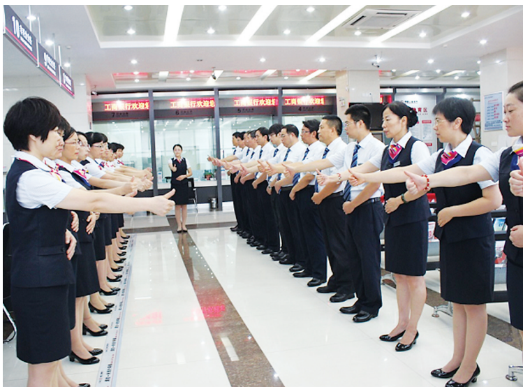
工行烟台分行开展服务培训活动。