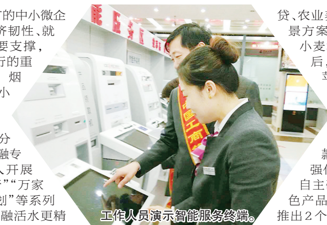
工作人员演示智能服务终端。

量多面广的中小微企业是我国经济韧性、就业韧性的重要支撑，也是烟台工行的重点支持对象。烟台工行心系小微企业发展，建立“1+9”（1家中心、9家分中心）小微金融专营模式，深入开展“工银普惠行”“万家小微成长计划”等系列活动，推动金融活水更精准快速流向小微企业。