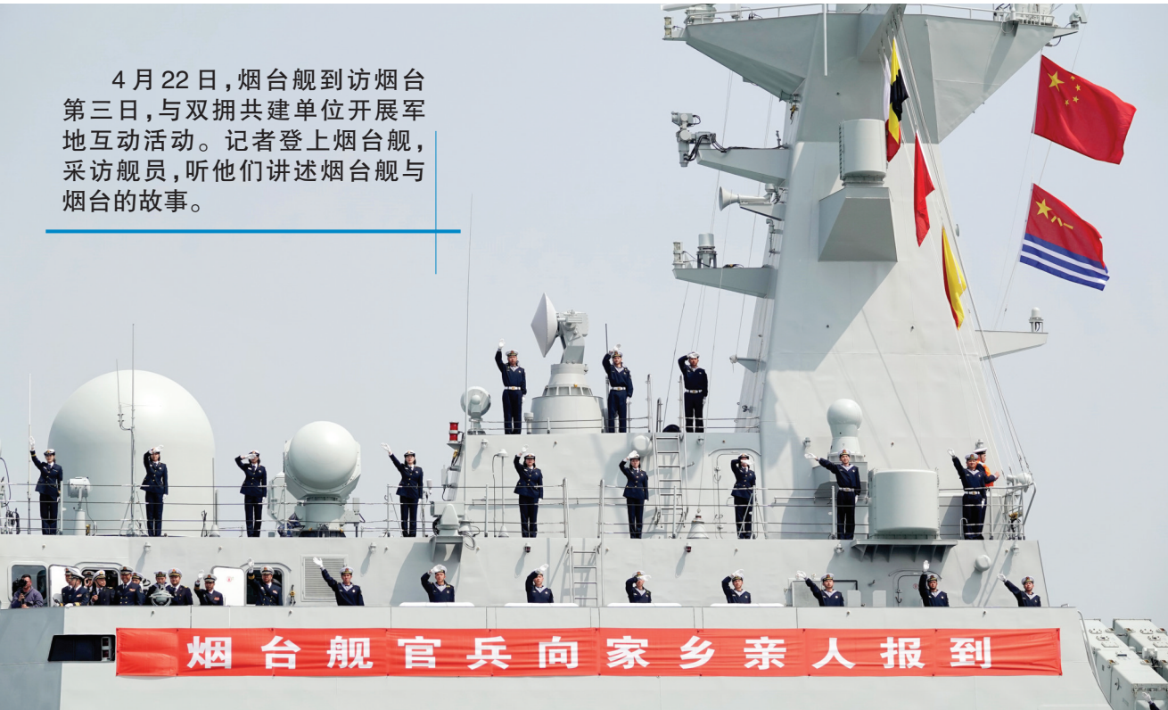
烟台舰上的官兵向家乡亲人挥手致意。