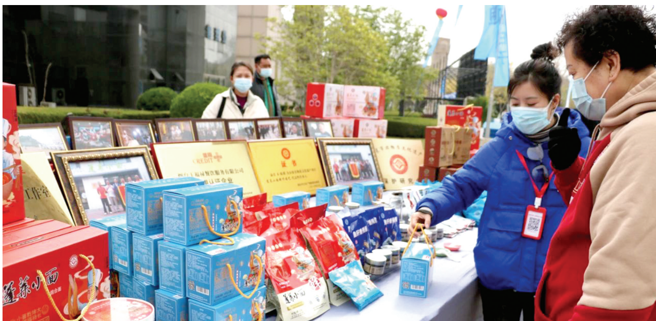
活动现场,蓬莱本土餐饮企业进行了“仙食蓬莱”美食展售。

本报讯(YMG全媒体记者 刘晓阳 通讯员 黄原 朱静 摄影报道)4月22日(农历三月初三)上午9:00,蓬莱“八仙过海旅游节”启动暨“八仙过海日”庆典活动在蓬莱区和平颂文化广场举行。