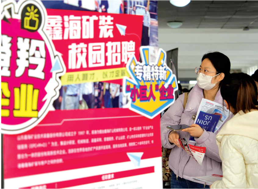
毕业生在招聘会上了解岗位信息。

“招引人才”与“推介城市”有机融合,城市的吸引力就被放大了。人社部门联合发改、文旅等部门,通过市领导宣讲、视频推介和政策解读等多种方式,构建“人才招聘+产业优势、文旅资源、人才新政”推介模式,开展各类宣讲会6场次,激发了人才来烟留烟就业创