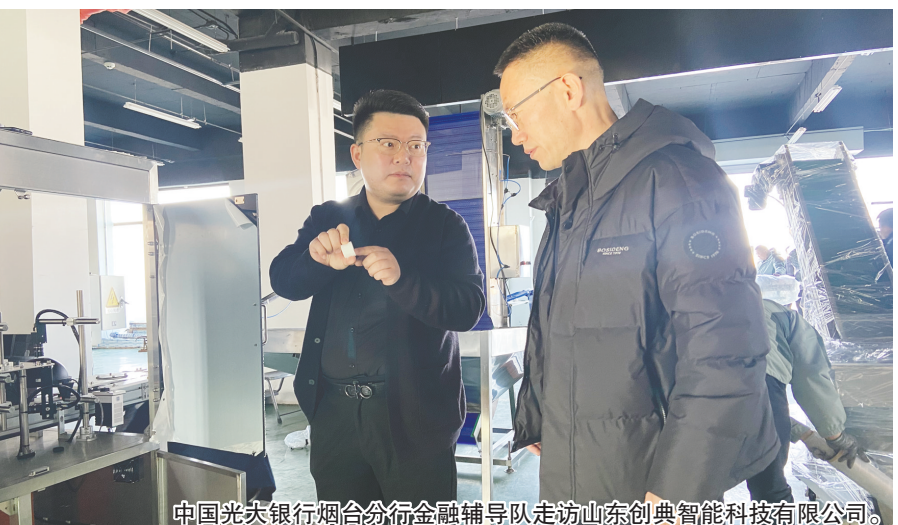
中国光大银行烟台分行金融辅导队走访山东创典智能科技有限公司。

一季度,全行批复一般风险对公授信 153 笔、220 亿元,批复笔数、金额同比分别增长 39%、206%;对公人民币贷款新增 64 亿元,增幅近 20%。其中,制造业贷款实现结构优化、质量提升,涉农贷款持续发力、增量领先,绿色金融做出有益探索,落地烟台市首笔碳排放权质押融资业务。制造业中长期、民营企业、普惠金融、乡村振兴等实体经济重点领域和薄弱环节贷款均保持 10% 以上的增速。