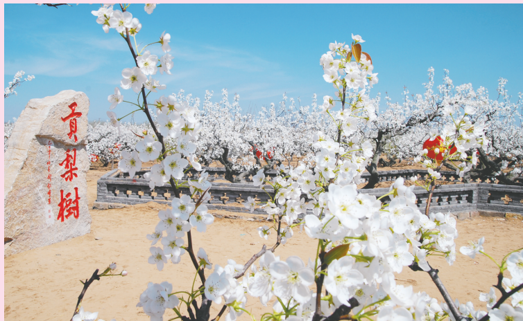
↑ 梨乡风情旅游区内梨园。