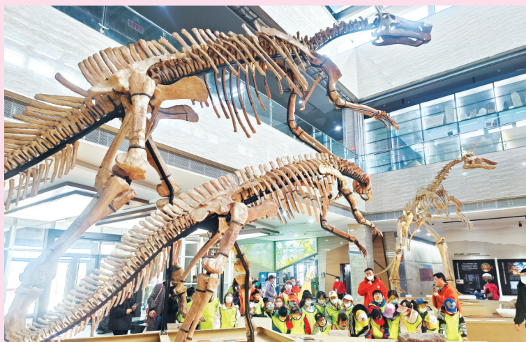
↑ 莱阳白垩纪国家地质公园内，孩子们参加研学之旅。