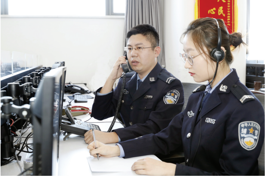
市公安局指挥中心24小时接听报警电话。

守港城平安、护万家安宁，这是他们肩负的使命和职责，“我们一直强调‘再快一秒’，党指向哪里，就冲锋到哪里，哪里困难