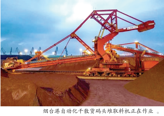
烟台港自动化干散货码头堆取料机正在作业。

烟台与日本、韩国隔海相望,贸易往来频繁。烟台港是“一带一路”倡议确定的15个重点建设的沿海城市港口之一,烟台港深入践行山东港口“东西双向互济,陆海内外联动”的发展路径,积极融入“一带一路”倡议,以辐射日韩物流链优势为基础,以率先打开混配业务局面为抓手,依托这条成熟的物流通道,不断提升服务效能,擦亮烟台港“铁矿石混配”品牌,推动混配矿日韩保税转口业务再上新台阶,促进“一带一路”上中日韩三国互联互通。