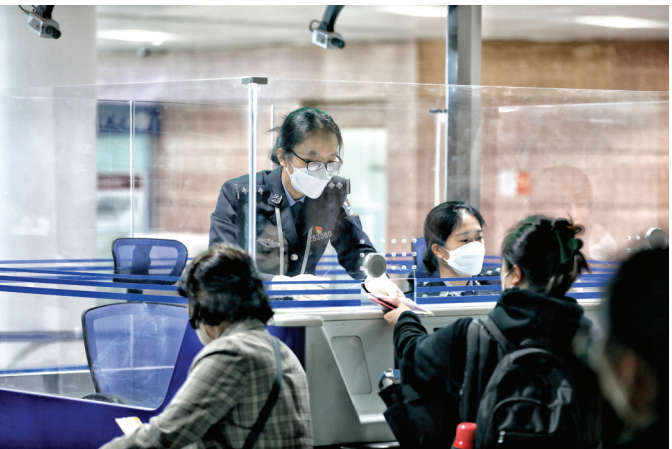
民警快速核查办理旅客通关手续。

“速度很快! 体验很好!” 烟台机场边检全力保障“乙类乙管”后首趟国际客运航班复航