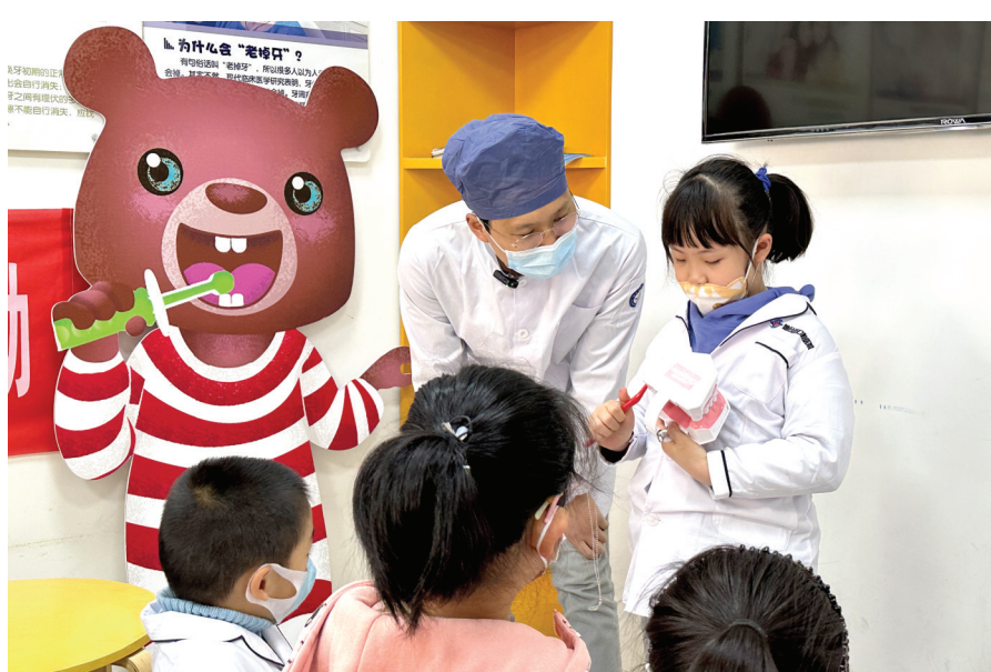
小朋友们正在学习正确的刷牙方式。

健康口腔而自豪’。在接下来的一周,医院将会开展各种形式的口腔健康活动,包括社区义诊、讲座宣教、免费口腔检查、院