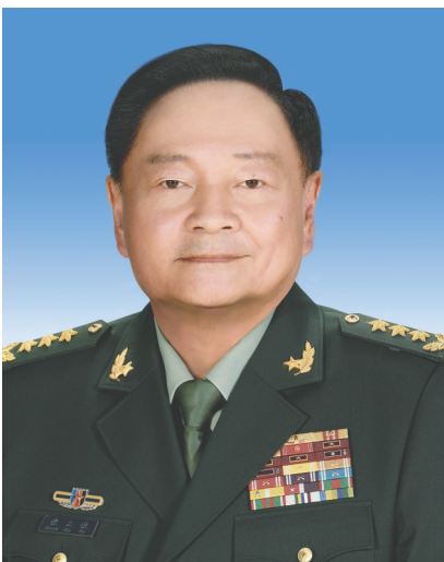
中华人民共和国中央军事委员会副主席 张又侠