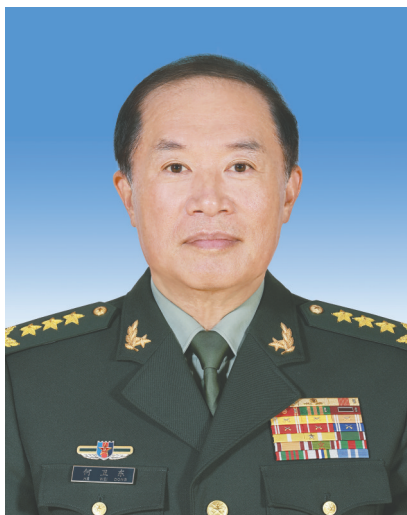
中华人民共和国中央军事委员会副主席 何卫东

张又侠，男，汉族，1950年7月生，陕西渭南人，1968年12月入伍，1969年5月加入中国共产党，军事学院基本系毕业，大专学历。 现任中共二十届中央政治局委员，中共中央军事委员会副主席，中华人民共和国中央军事委员会副主席，陆军上将军衔。