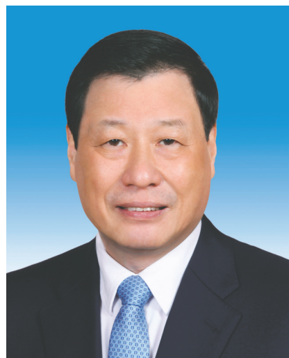
最高人民检察院检察长 应 勇

张军，男，汉族，1956年10月生，山东博兴人，1973年1月参加工作，1974年5月加入中国共产党，中国人民大学法律系刑法专业毕业，研究生学历，法学博士学位。 现任中共二十届中央委员，最高人民法院院长、党组书记、审判委员会委员，首席大法官。