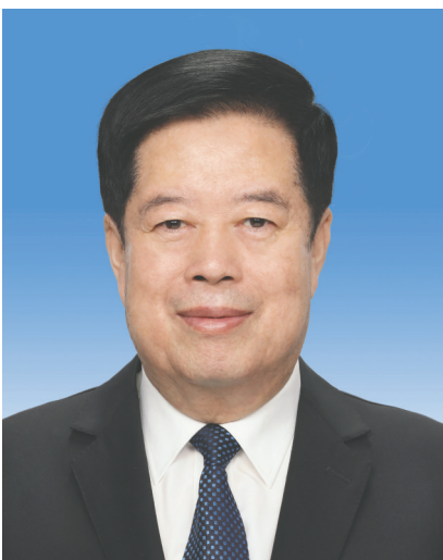
国家监察委员会主任 刘金国

刘金国，男，汉族，1955年4月生，河北昌黎人，1976年12月参加工作，1975年9月加入中国共产党，中央党校大学学历。 现任中共二十届中央书记处书记，中央纪律检查委员会副书记，国家监察委员会主任，总监察官。