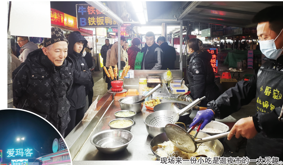
现场来一份小吃是逛夜市的一大乐趣。

夜经济的发展,美食可是贡献了半壁江山。在莱州夜市,有现烤的玉米、现煮的烧仙草,还有烤生蚝、炸臭豆腐、锅包肉、羊肉串、水果捞等美食,从夜市里走一走,就算是吃饱肚子出的门,闻到香味也要流口水了。