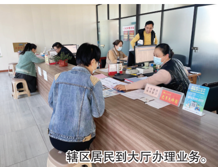
辖区居民到大厅办理业务。

近年来,武宁街道坚持以人民为中心的发展思想,不断提升政务服务水平,制定“党建+政务服务”工作体系,扎实推进“我为群众办实事”实践活动,深入农村、社区、企业、园区等一线,“近距离”为企业和群众提供规范、便捷、高效的服务,切实提升人民群众的获得感、幸福感、安全感。