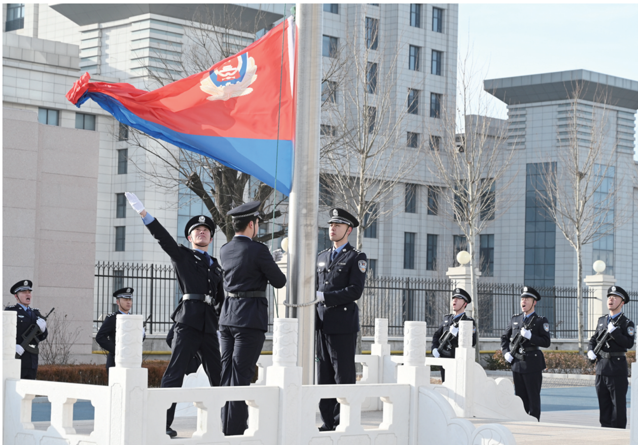
人民警察节升警旗仪式。

开展集中统一行动，形成强大声势。率先启动“飓风行动”，与全国公安机关夏季社会治安打击整治“百日行动”一体化推进，全面加强商业街区、烧烤一条街、酒吧、KTV等重点区域的社会面巡防管控，将打击的锋芒对准严重影响群众安全感的违法犯罪，对寻衅滋事、聚众斗殴、在公共场所殴打他人、故意