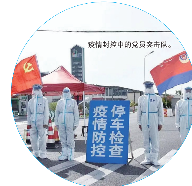
疫情封控中的党员突击队。

和人民群众的安全，危难中，广大交警、巡警挺身而出，指挥疏导交通、救助被困的群众和儿童。无论是风霜雨雪还是严寒酷暑，他们始终坚守岗位，成为群众回家的航标。每当家人找不到时、每当物品丢失时、每当邻里纠纷时，在群众最需要的时候，用心去做，全力完成，让群众满意。