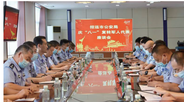
庆“八一”复转军人代表座谈会。