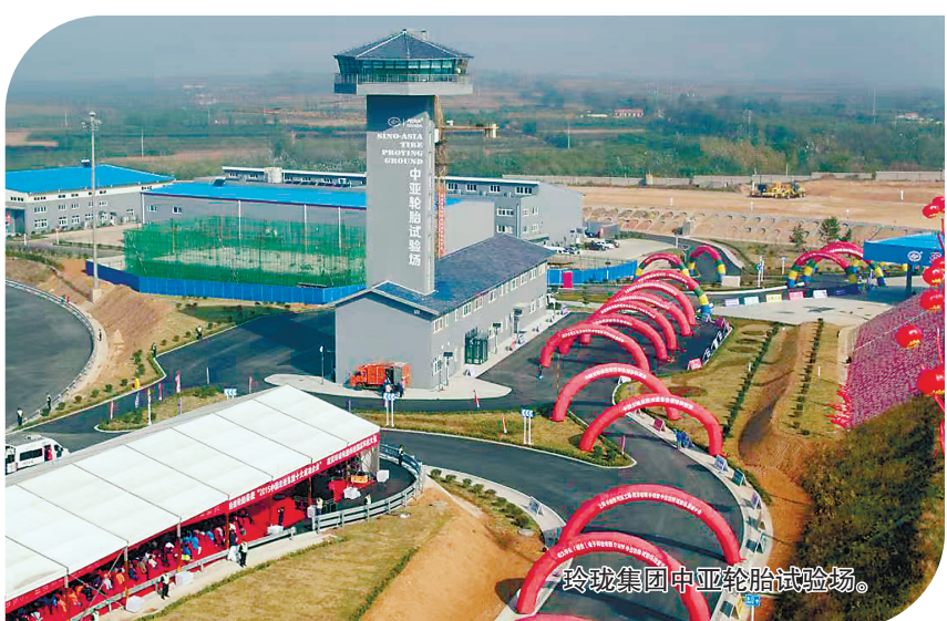
玲珑集团中亚轮胎试验场。