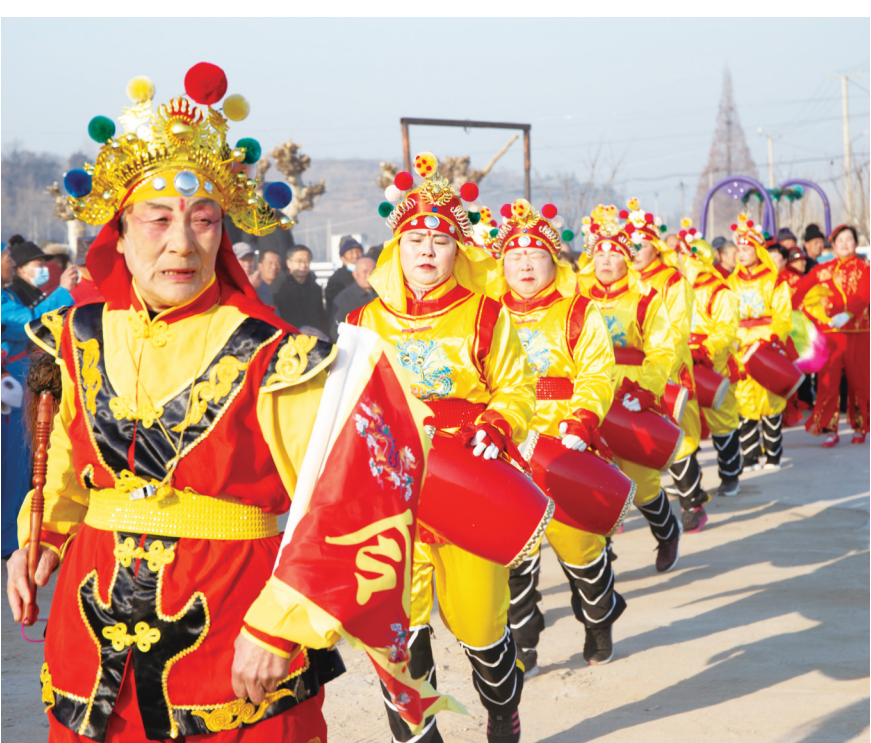
正月扭秧歌、敲锣鼓是中华民族由来已久的春节传统民俗。与往年不同的是，莱阳市龙旺庄街道止凤村秧歌队今年邀请了好邻居道仙庄村秧歌队进行联袂演出。表演现场，两支秧歌队时而交叉行进变换队形、时而劲舞红绸挥动彩扇，合作演绎跑毛驴、驴打滚等经典桥段，引得围观群众连连叫好，大家纷纷拿起手机用镜头记录下这热闹精彩时刻，呈现出一派吉祥如意、平安欢乐的浓厚氛围。(郭子蒙 宫小丽)

新年伊始，莱阳开发区管委按照省委、省政府在济南召开全省加力提速工业经济高质量发展大会部署，全力践行莱阳市委、市政府“11349”总体发展战略，以“开局就是决战，起步就是冲刺”，奋勇拼搏、加力提速，促进工业经济持续回升向好，实现了首季“开门红”。 到目前为止，莱阳开发区全部规上企业已全部复工复产，海尔智慧厨电公司1月份克服疫情影响，实现营收1.01亿元、同比增长48%，全年预计生产厨房电器220万套，营收20亿元，同比增长33%；潍柴商用车公司2023年的产销目标不低于4万辆，出口5000辆，实现营业收入50亿元以上，比2022年增长257.1%。 今年，莱阳开发区计划实施重大项目包括万润新材料、国药产业园、中欧新材料、商用车零部件产业园、省供销社城乡共配中心、胶东铁路物流等14个，总投资超过450亿元，2023年完成投资50亿元以上。为此，莱阳开发区管委联合自规、发改、工信、财政、环保等兄弟部门，积极对上争取土地、资金、能耗、污染物排放等要素保障，力争年内所有成熟的项目开工建设。 莱阳开发区管委逐一分析在建项目的要素保障需求，现场解决供水、供电、施工项目手续办理的各项需要，确保项目有序推进，为建设铺平道路。目前，莱阳开发区在建的大项目有昌誉密封、春帆环境等6个，总投资超30亿元，7月前昌誉和春帆将要投产，年底前冠宏、舜康、裕铭等4个项目全部投产，预计当年增加固定资产投资15亿元，增加营业收入5亿元，全部达产后增加营业收入超30亿元。 依托现有新能源企业、装备制造、高端化工、现代物流四大主导产业，按照“延链、强链、补链”的招商思路，发挥产业链的积极性和主动性，莱阳开发区管委有针对性地引进一批牵引性强的重大项目好项目。新能源汽车产业链抓好凯盟模具、镁轮毂、德散热器、舒驰客车二期技改项目重启等项目的洽谈推进；装备制造重点推进海尔二期和产业链延伸项目；高端化工方面主要推进化工园1.85平方公里的二期扩区工作，为项目落地腾出发展空间；现代物流方面重点推进中远海运化学品物流、山东高速物流、山东港口港等项目。项目推进实行链办负责制，安排专人跟踪服务，认真解答投资方的疑问并解决项目推进过程中遇到的困难，力争在谈项目年内有大的突破。 莱阳开发区管委通过融资、扩股等方式，引进战略投资，解决本土企业的资金瓶颈；与研发机构、高校和科研院所合作，引进技术量和人才提升企业产品技术含量，提高产品档次；通过技改扩大生产规模，加大产品市场占有率。同时，他们将会同发改、工信、科技、统计等兄弟单位，积极宣传技改、人才、高新技术、小升规等扶持政策，引导鼓励现有企业走出去，拓展发展空间，尽快做强做大，争取在未来3至5年内，有条件的企业全部实现产业升级。(柳玉栋)