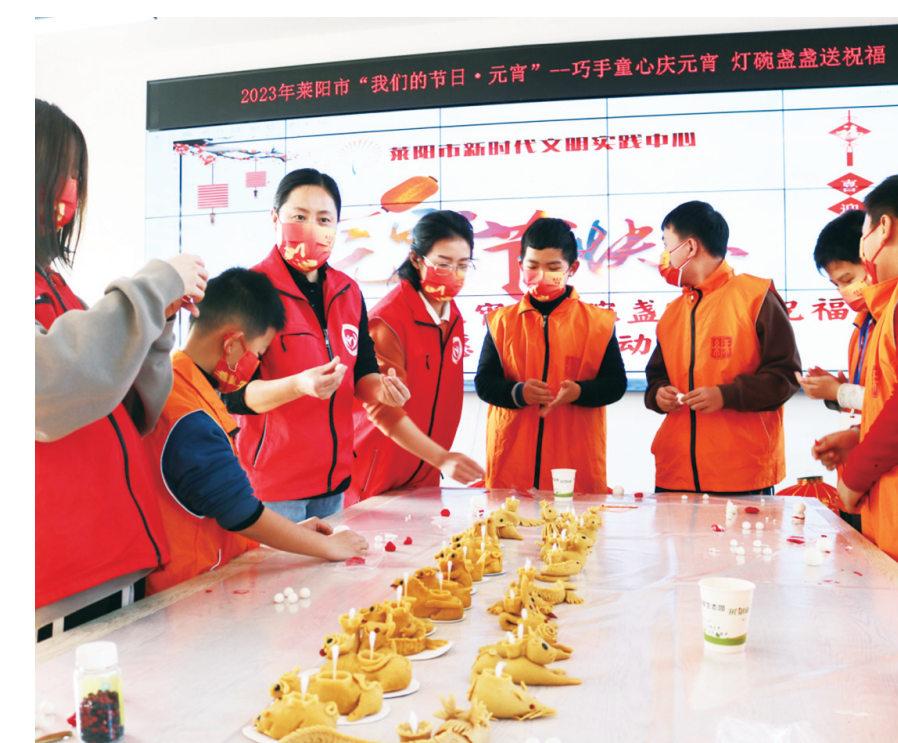
2月3日，莱阳市新时代文明实践中心组织莱阳市众城志愿服务中心、梨乡星爱心公益发展中心、城厢街道天龙社区等志愿团队、社区组织开展了“我们的节日元宵”系列文明实践活动。他们通过现场教授制作豆面灯碗、为老人包饺子送温暖、体验猜灯谜等方式，营造了良好的节日氛围，让市民群众感受传统节日的文化力量，传承民族文化，弘扬社会新风。(张为东 吴明月)