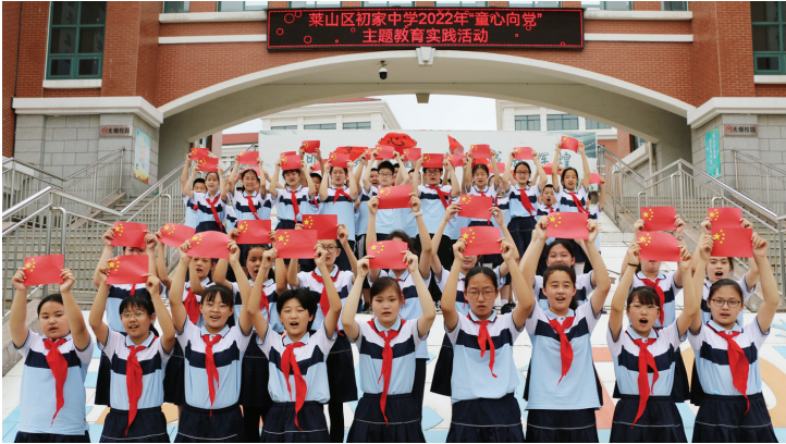
初家中学开展“知史明理”教育实践活动。(资料片)

学校把文明建设放在日常工作中的重要位置,成立文明校园创建工作领导小组,校长全面负责创建工作,党支部主抓落实工作,工会、团委办公室、总务处、政教处、教务处各负其责,通过抓学习、建制度、搞活动、鼓励广大教师的文明意识进一步提高,让教师将文明的行为传递给学生,共同做好文明校园创建工作。