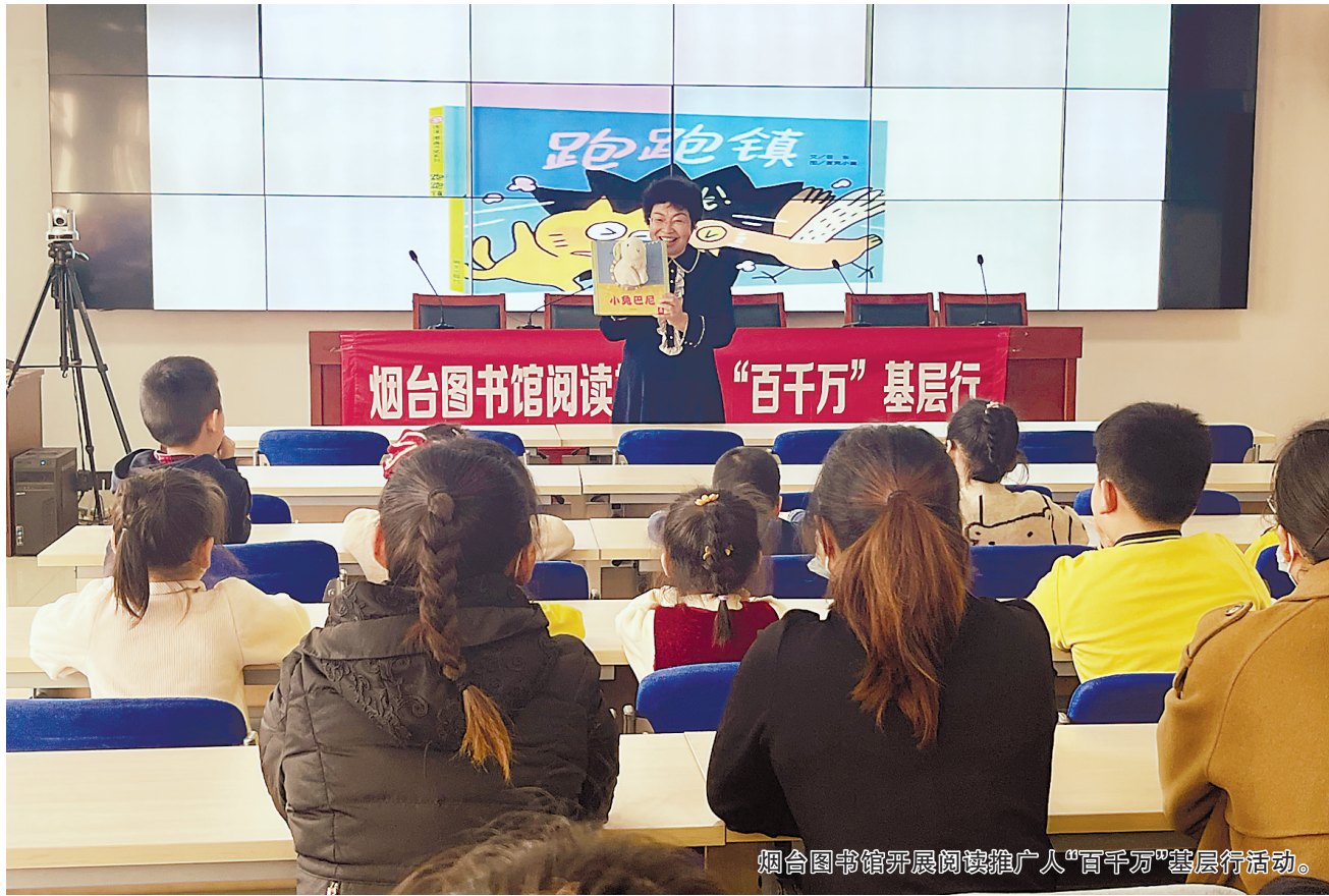
烟台图书馆开展阅读推广人“百千万”基层行活动。

近日,中宣部发出通知,要求各地各新闻单位认真开展“新春走基层”活动,全面反映各地统筹疫情防控和经济社会发展取得的积极成效,生动展示广大人民群众欢乐祥和过春节的喜人景象,齐心协力营造喜庆安康、昂扬向上的节日氛围。今起,本报开设“新春走基层”专栏,聚焦学习贯彻党的二十大精神的新举措新进展新成效,努力克服疫情影响推进经济高质量发展,结合优化疫情防控措施开展丰富多彩的节庆文化活动等,全面反映人民群众自身工作生活的点滴变化和切身感受,生动展示群众文化生活新趣味新时尚、阖家团圆过大年的热闹情景,持续推动党的二十大精神在基层落地生根,凝聚广大干部群众团结奋进力量。